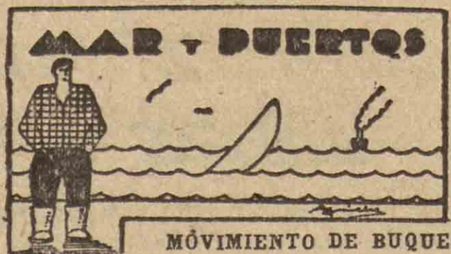
MÓVIMIENTO DE BUQUES

En nuestro puerto no se registró durante el día de ayer ninguna entrada ni salida de buques mercantes. La dársena continuó vacía de esta clase de embarcaciones y la vida de tráfico estuvo paralizada un día más, dando la sensación de inquietante quietud.