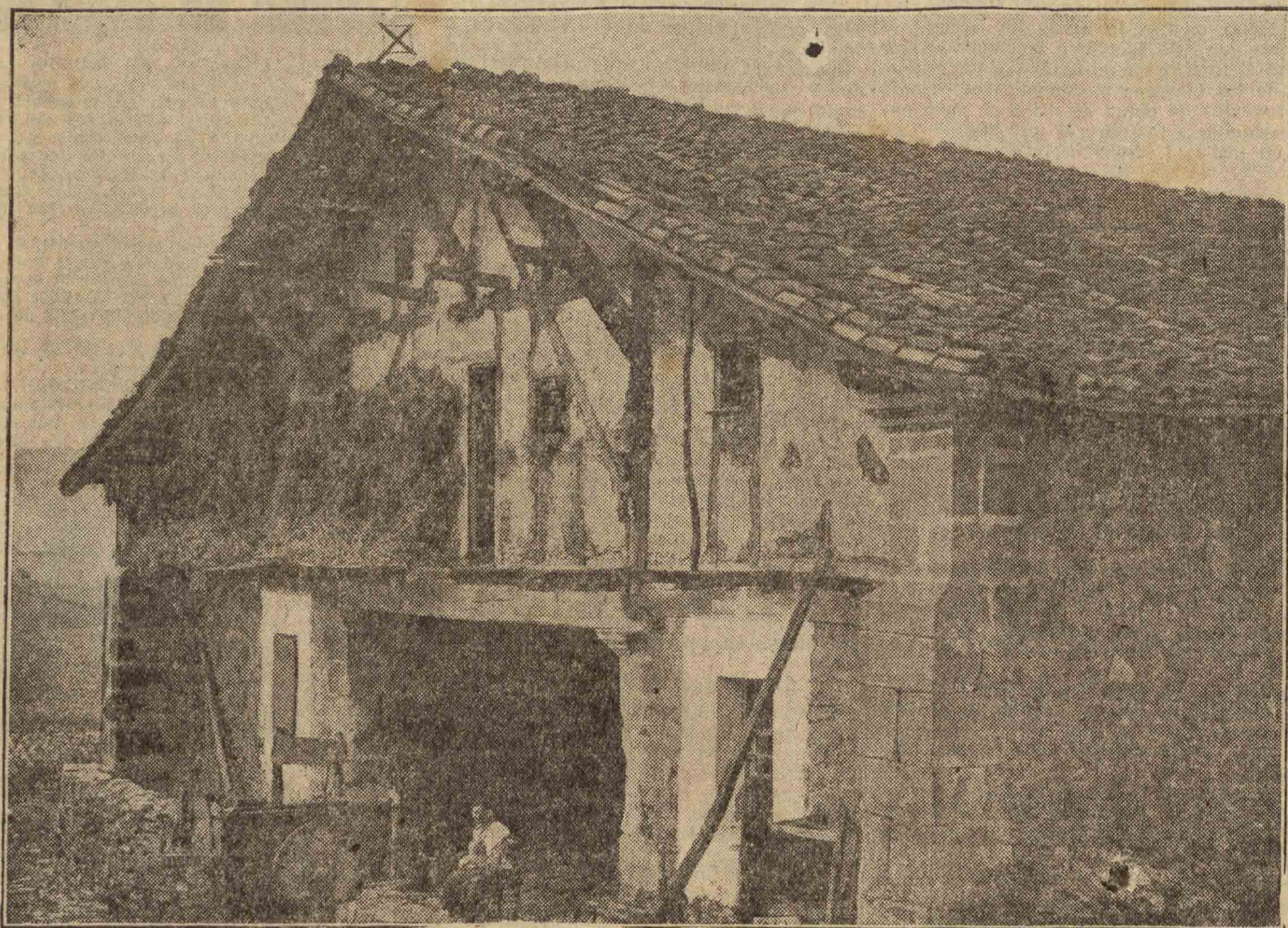
CASERIO DE GATICA BUTRON