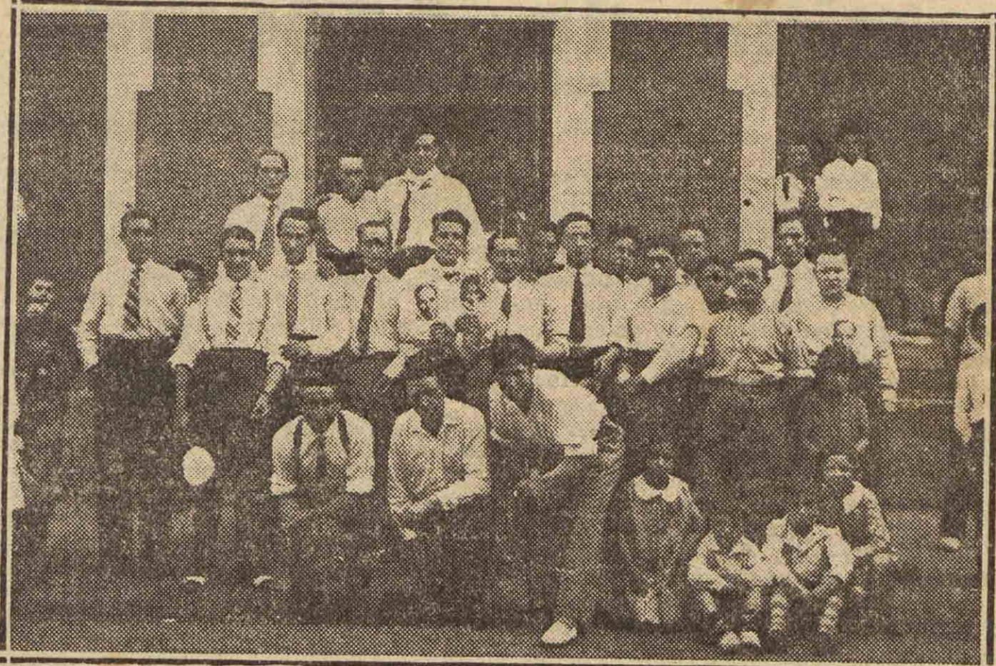
RENTERIA. — Componentes de la "Piña Ansoa" que se reunieron en fraternal banquete para conmemorar el segundo aniversario de su fundación.