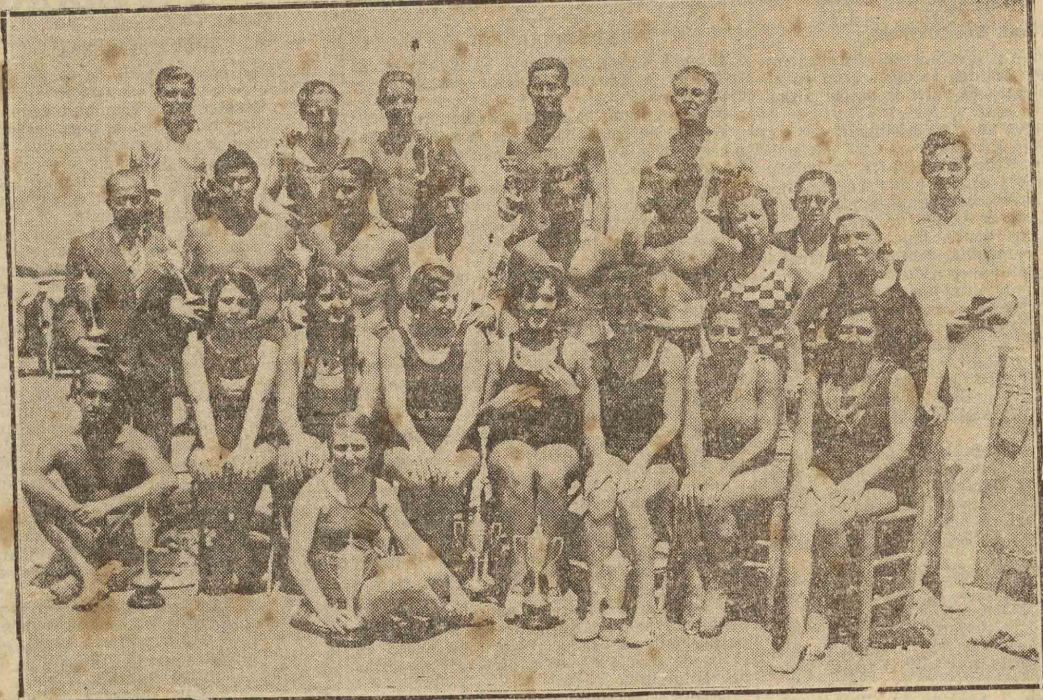
Reparto de premios a las nadadoras y nadadores de dicho Club que han obtenido premio en las diferentes pruebas y concursos corridas durante la actual temporada. (F. Hernando.)