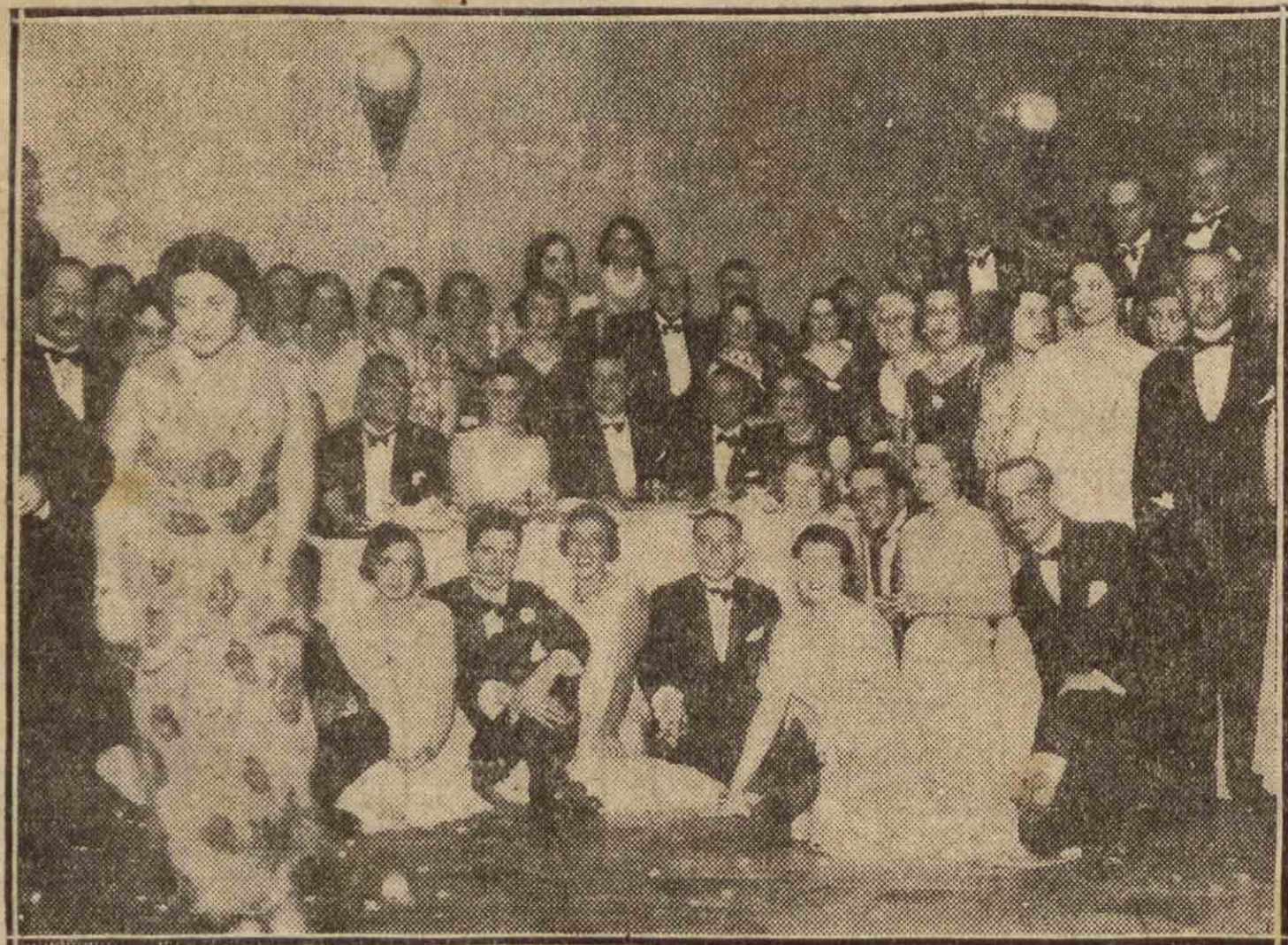
IRUN. — El gobernador de Guipúzcoa, señor Aldasoro, en la cena americana celebrada con motivo de la inauguración del nuevo Casino de Irún.

Se convoca a todos los adheridos y simpatizantes de la "Izquierda Revolucionaria y Antimperialista" a una reunión que se celebrará mañana, jueves, a las siete y media, en el local de la Escuela de Declamación Vasca (calle Garibay). Se ruega la más puntual y numerosa concurrencia.—El Comité.