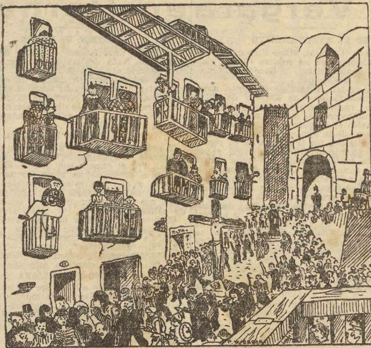
UN "APUNTE" DE LA PROCESION DE VIERNES SANTO, EN FUENTERRABIA.

TOS GRIPPE-BRONQUITIS CURACION SEGURA CON THIUCOLINA D. CALBETO