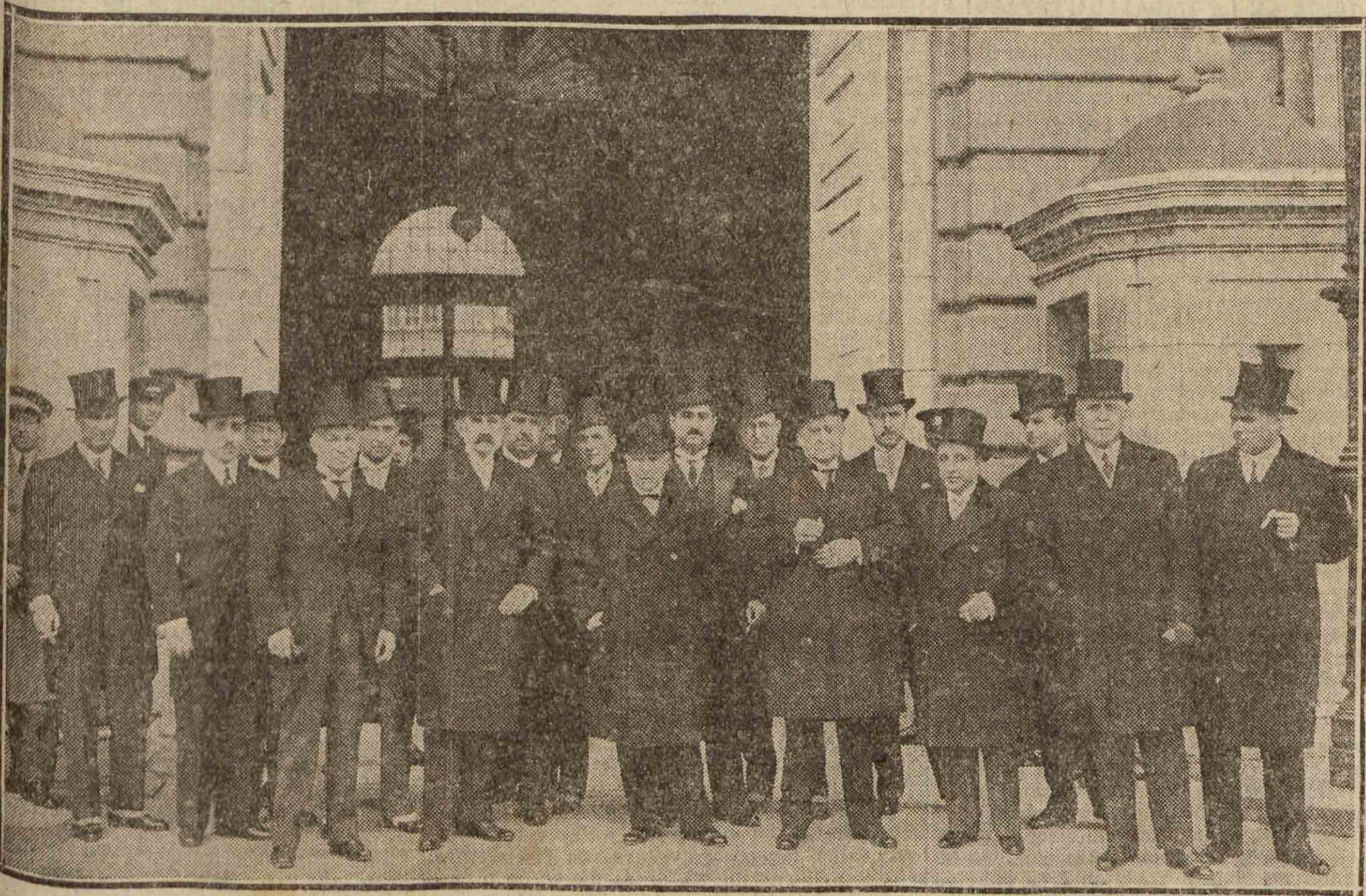
La mitad de la «Embajada Guipuzcoana» al salir de Palacio después de cumplimentar a don Alfonso.