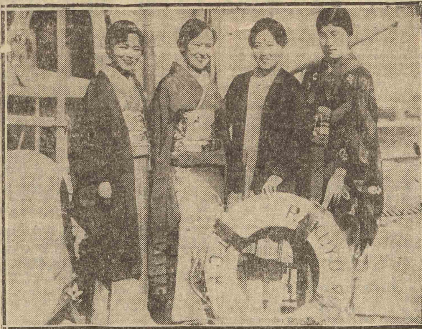
NUEVA YORK. — Cuatro japonesas que han llegado a los Estados Unidos a reunirse con sus esposos, también japoneses, y a los que no conocieron hasta llegar a América, habiéndose tratado por correspondencia y unido por poderes.

MEDICINA GENERAL Enfermedades nerviosas y de niños. Nutrición. Electricidad. Consulta de 11 a 1 y 4 a 7. Económica, martes y sábados. Príncipe, 37, 4.º Teléfono 12-5-49.