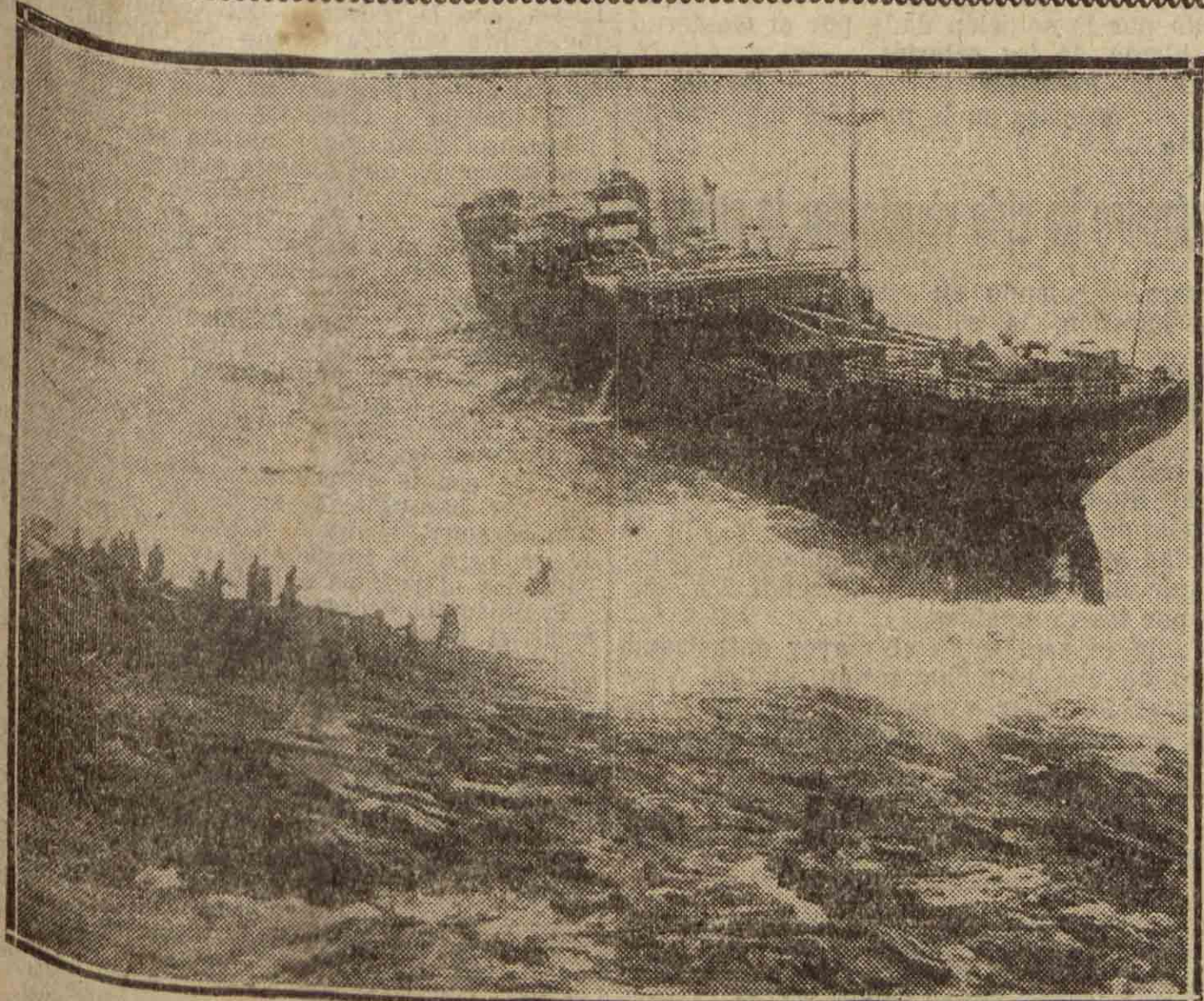
INGLATERRA. — El salvamento de la tripulación del buque "Bennorhr", que encalló en la costa del sur de Devon. (Foto Consorcio).

En vista de ello el Claustro acordó retirar la dimisión que tenía presentada, quedando por lo tanto solucionado el conflicto.