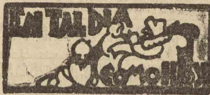
SAN SEBASTIAN HACE 30 AÑOS

4 MARZO 1901. «Había crisis ministerial, que es una de las cosas que más han abundado siempre en España. Por eso se esperaban, no con ansiedad, sino con curiosidad nada más las noticias acerca de la solución. Y cuando se supo que había sido encargado de formar Gobierno el general Ascaraga, las gentes fueron a mirar al calendario a ver si estábamos en 28 de diciembre.