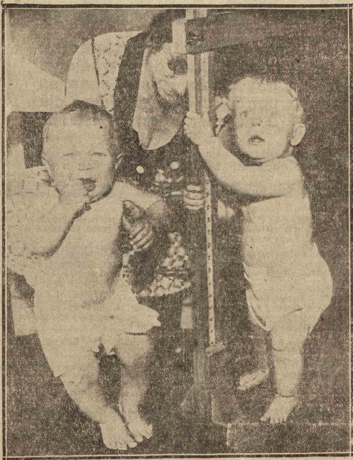
MIDIENDO A DOS BUENOS EJEMPLARES.

He de repetir que el lunes o el martes se reanudarán las clases en la Universidad de Madrid, y espero que lo mismo se hará en las demás.