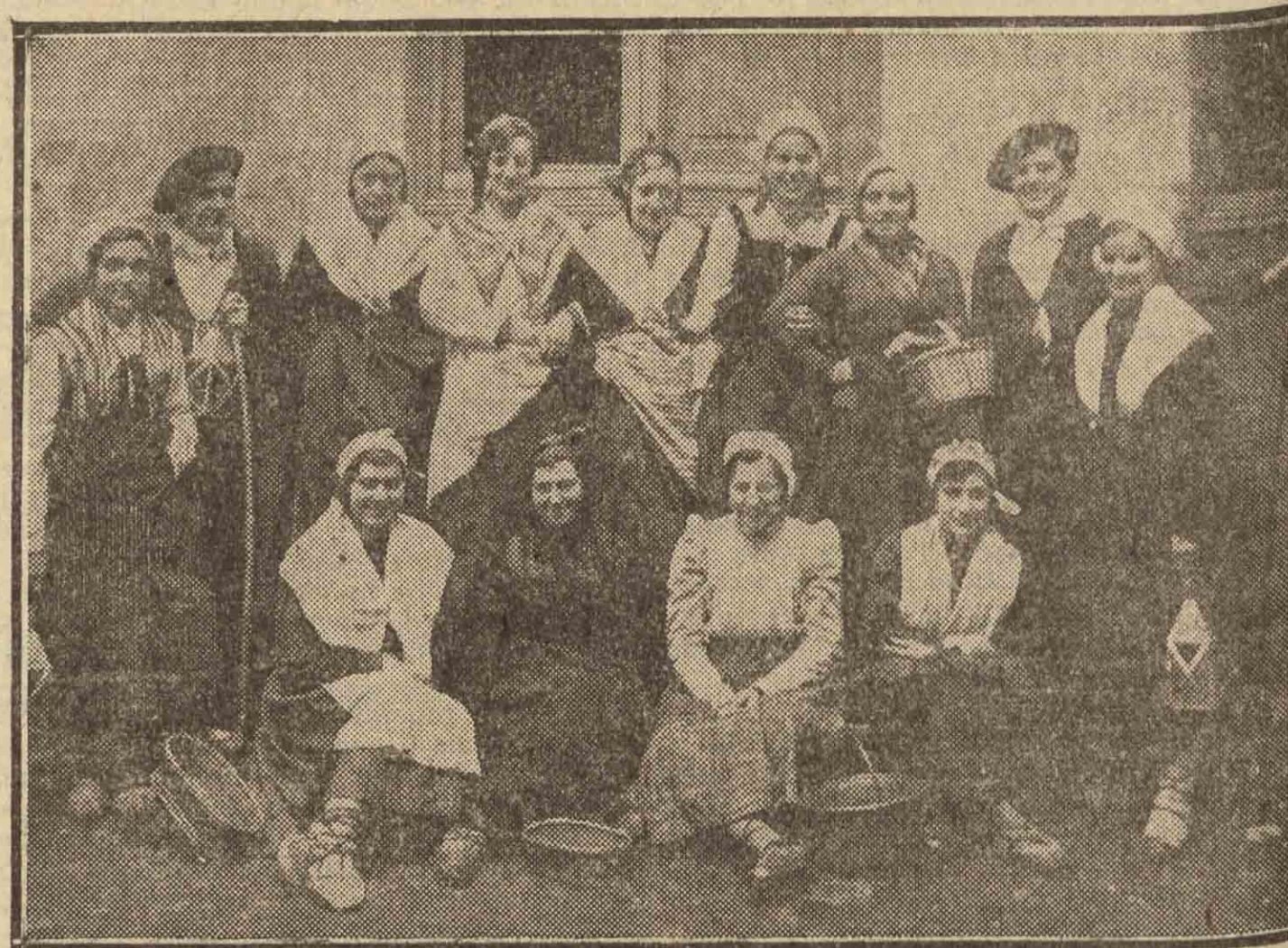
VILLAFRANCA DE ORIA. — Bellas y distinguidas señoras de la localidad que postularon para recaudar fondos para socorrer a las familias que perdieron su albergue con motivo del corrimiento de tierras en el vecino pueblo de Isasondo.