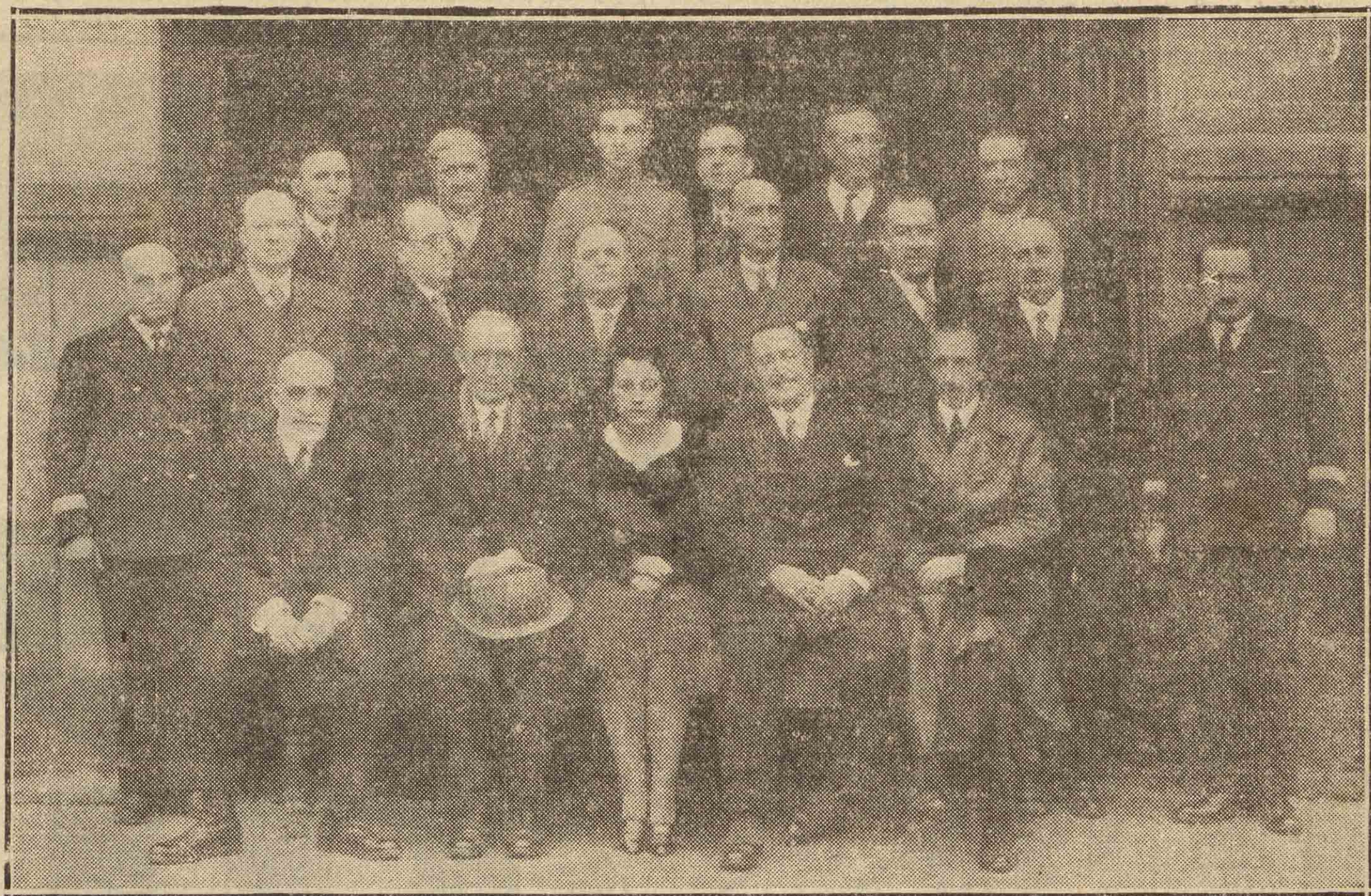
PERSONAL DE ADUANAS DE LA ADMINISTRACION PRINCIPAL DE SAN SEBASTIAN.

ESPECIALISTA EN ENFERMEDADES DE LA PIEL Y SECRETAS Consultas de diez a una y de cuatro a siete ALAMEDA, 6, 1.ª — Teléfono 1-29-29