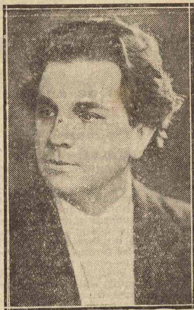
CIPILLE SLAVIANSKY director de la compañía de ópera rusa

«La Libertad»: — «La ópera fué gustada como merecía y alcanzó un éxito absoluto, y justo es decir que el de la compañía fué muy grande también. Podríamos poner en primer lugar los coros, que en las óperas