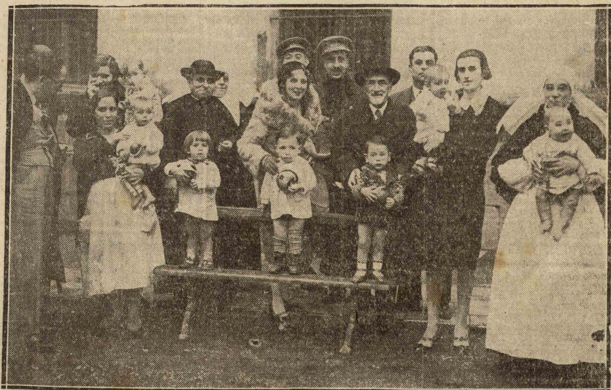
MADRID. — Don Jacinto Benavente, en la Cárcel de Mujeres, repartiendo juguetes entre los hijos de las reclusas, con motivo de la festividad de Reyes.

Las gratificaciones de casa que se conceden a las clases se elevan de 20 a 50 pesetas mensuales.