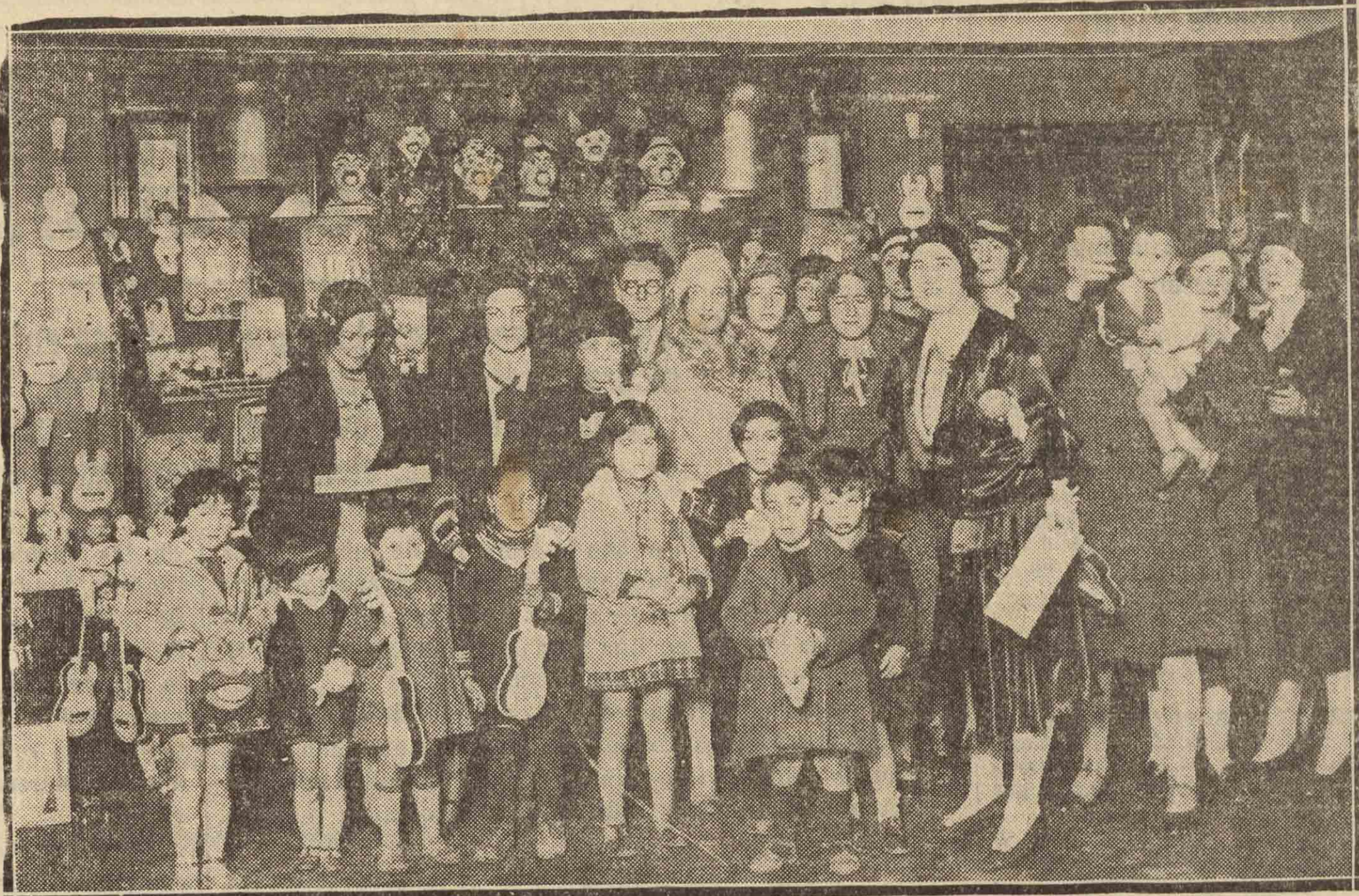
EN MADRID. — La Asociación de la Prensa cumple una de sus simpáticas misiones y se acuerda de los niños de los pobres. La señora de Casaval repartiendo juguetes.

Tiempo probable: Viento flojo del segundo cuadrante. Cielo nublado y claros. Alguna llovizna. Mar rizada. — LANDIN.