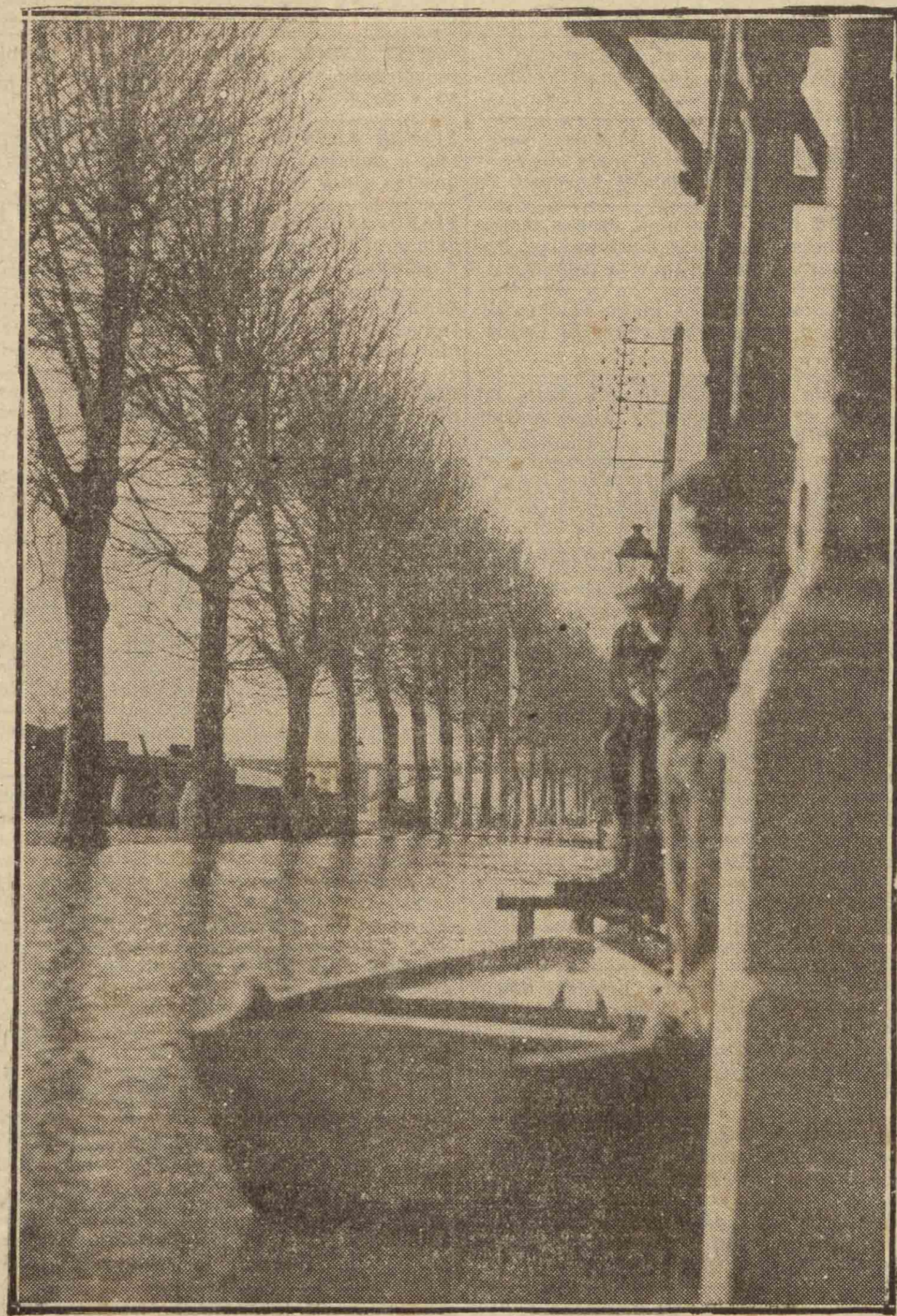
PARIS. — El público circula en barcasas por los mismos muelles.

Cuando los actuales alumnos sean profesores jubilados. — GORROCHA.