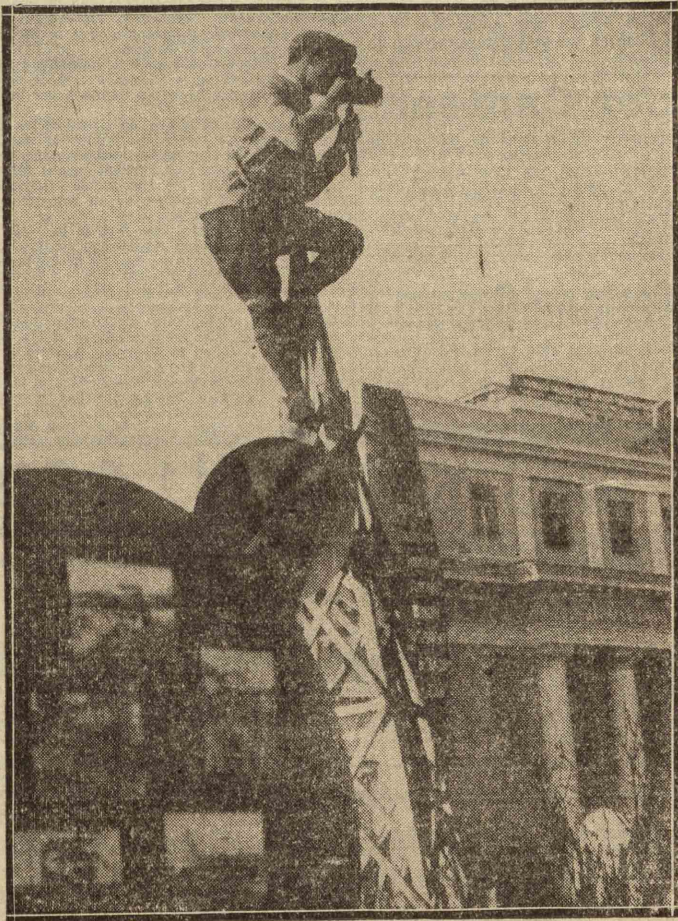
Las fiestas del 18.º aniversario de la Revolución Rusa, en Charcow.—Un corresponsal gráfico a caza de fotos.

RIOJANEIRO, 29. — Se asegura que cuando el ex presidente electo del Brasil, don Julio Prestes, llegue a Lisboa, es muy posible que fije su residencia en dicha ciudad y se ponga al frente de una Empresa comercial dedicada a la importación en Europa de cafés brasileños. (United Press.)