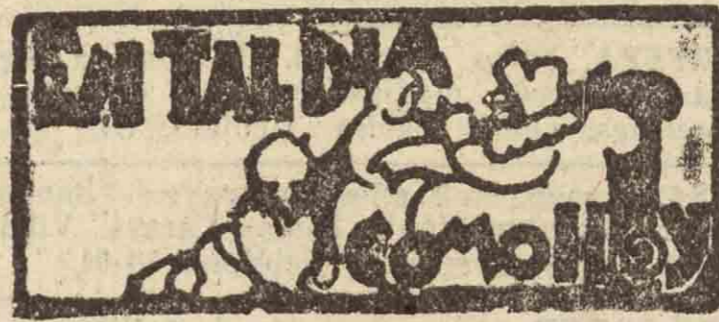
SAN SEBASTIAN HACE 30 AÑOS

Pero aún hay otra prueba más concluyente