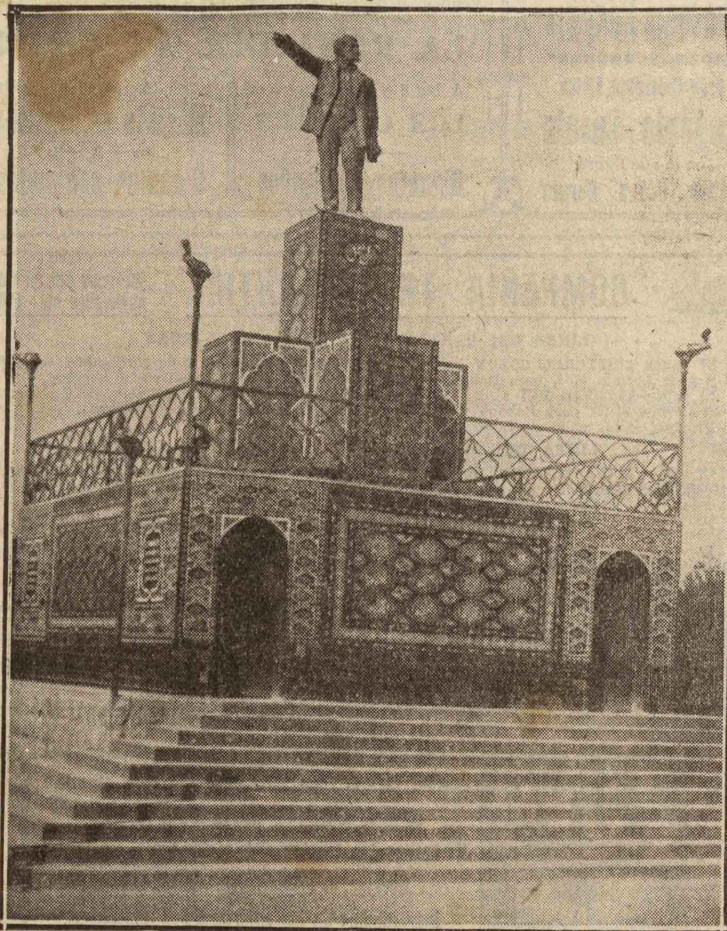
En Achachabad (Uzbekistan) se ha levantado un monumento cubista, vestido de mosaico y alumbrado por lampadarios candelabros, en honor de Lenin, el hombre que bajó su vista a la Humanidad y le señaló un camino acaso utópico.