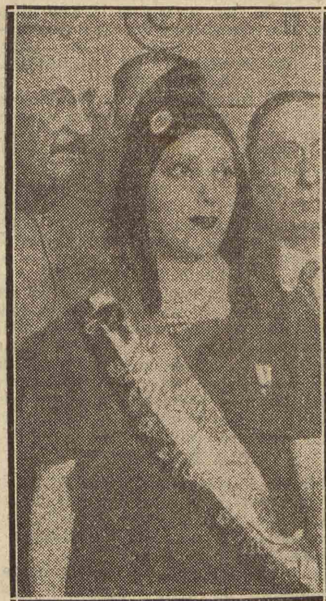
La canzonetista española Raquel Meller, en el momento de ser elegida «Mariana de las Marianas» para las fiestas que se celebrarán en París en conmemoración de la toma de la Bastilla.