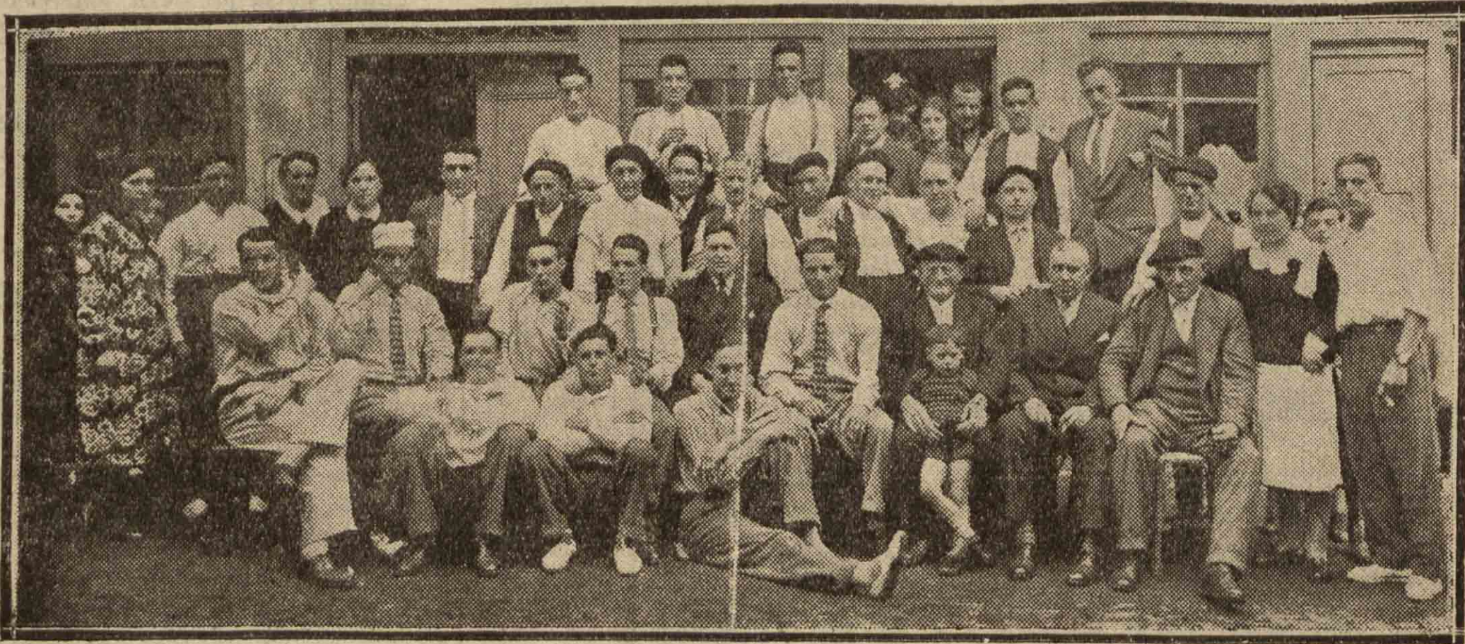
VILLAFRANCA. — Concurrerentes al banquete que se celebró con motivo de inaugurarse el «Solar Navarro».

Fué llevado a la Casa de Socorro donde recibió asistencia, trasladándose a continuación a la clínica San José.