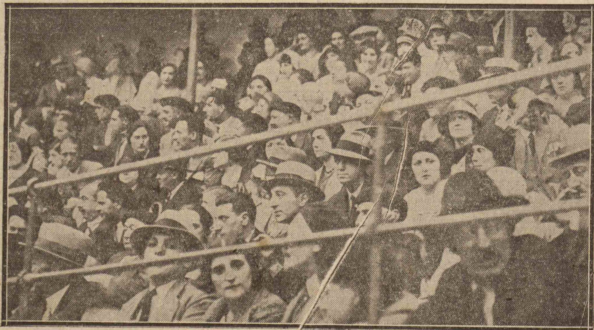
LA NOVILLADA DE AYER EN TOLOSA.—Aspecto de uno de los tendidos.