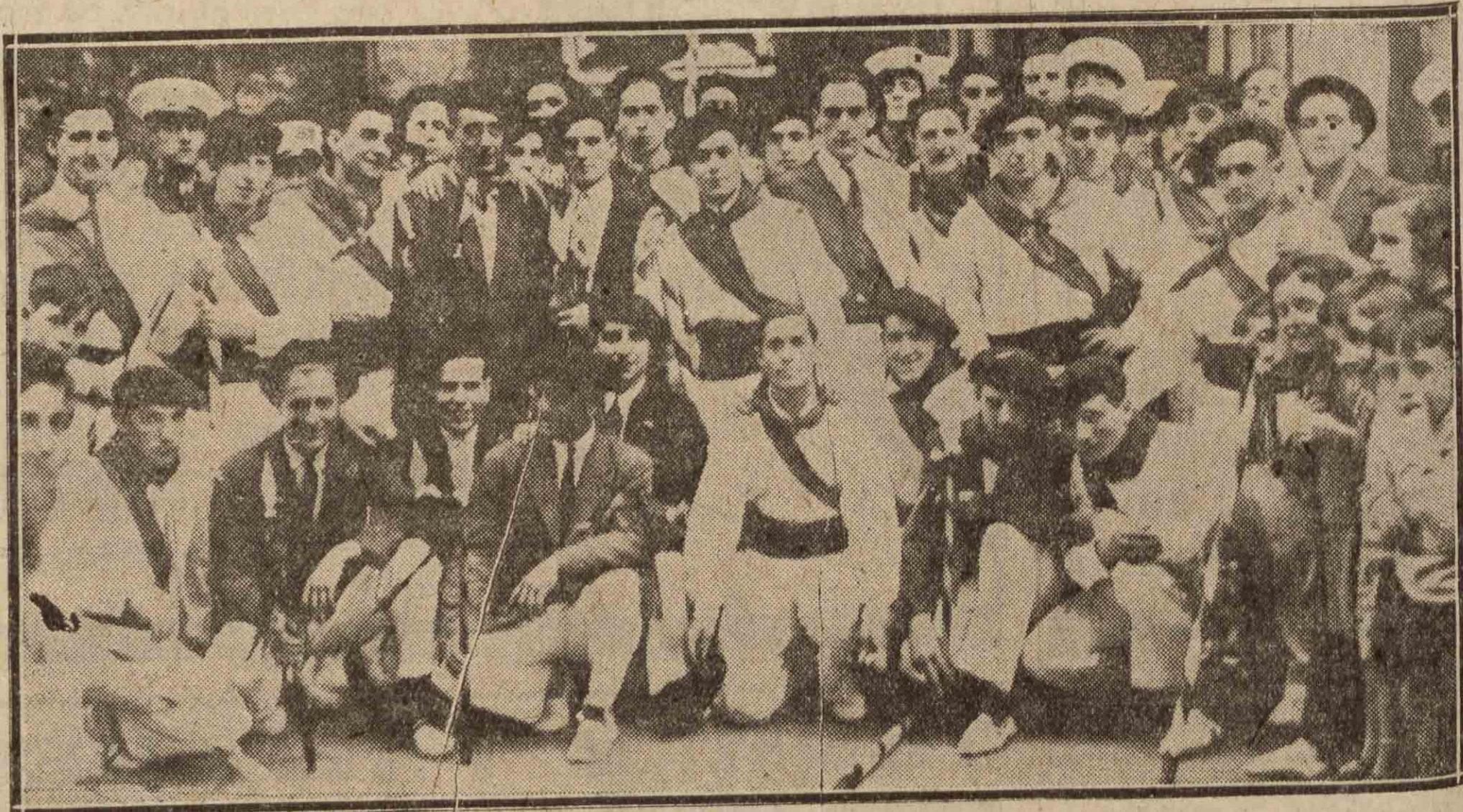
Los bordondantzaris de Tolosa, que recorrieron ayer las calles de la antigua capital foral.

Primero.—"Pajarito", negro. Obón torea con fiado, pero el bicho retrocede. Da una media verónica muy ceñida, que es aplaudida. El toro huye, dando gran trabajo a los de turno. Obón, viendo lo manso del bicho, no tiene más que a igualar, matan-