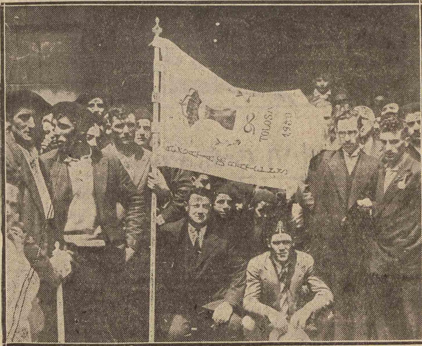
LAS REGATAS DE BATELES EN TOLOSA.—El alcalde de la villa entregando la bandera al vencedor, al remero de Orio. (Foto Guerequiz).

Después de la función religiosa en la parroquia, con asistencia de las autoridades,