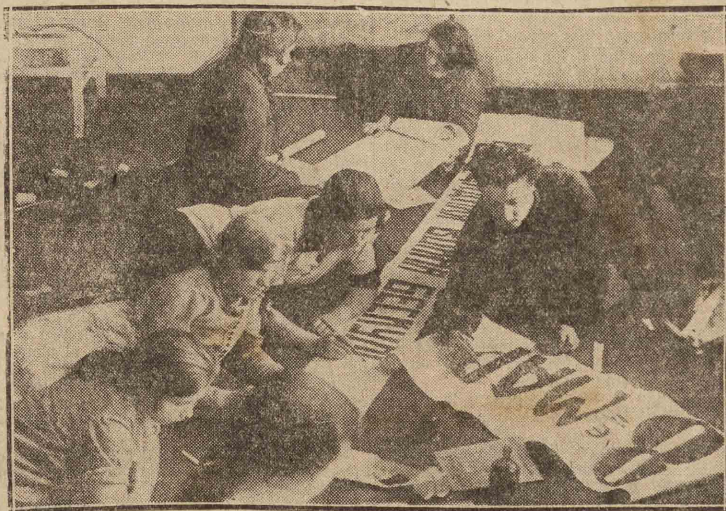
Un grupo de campesinas de Nijni Novgorod preparando el «Día de las Mujeres», que se celebró en Rusia el día 8 de marzo. Las muchachas pintan las banderas que luego llevaron en las manifestaciones y desfiles de la fiesta que los Soviets crearon para el feminismo ruso.