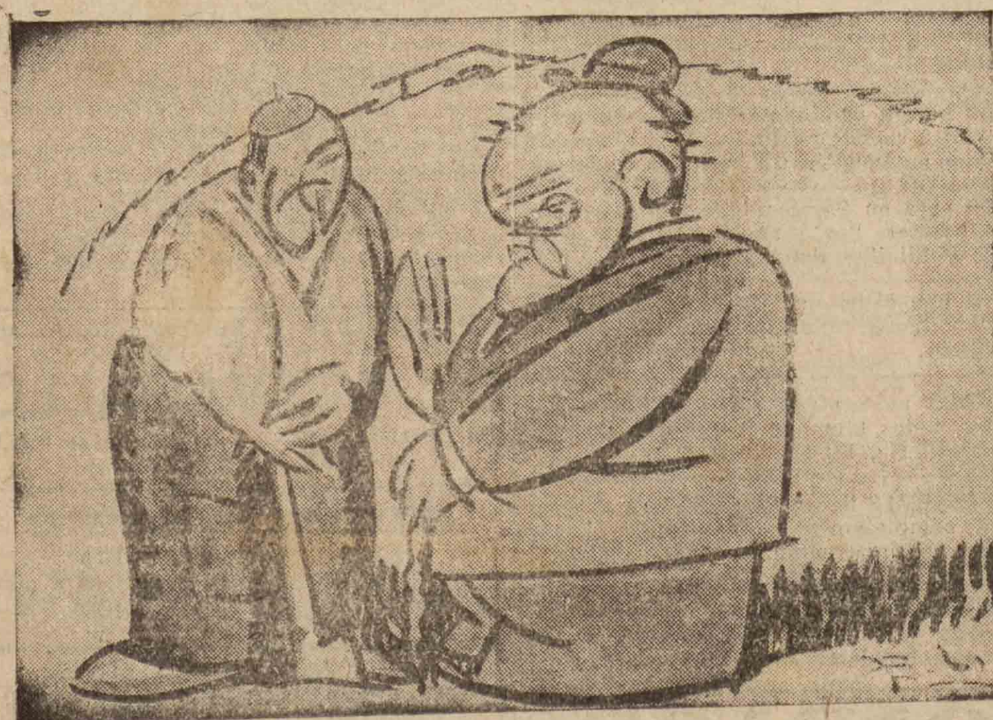
"El craneo del hombre de Pekin apuerece empotrado en la roca." (DE LOS PERIÓDOS.)

—También conozco yo quien tiene la roca empotrada en cabeza.