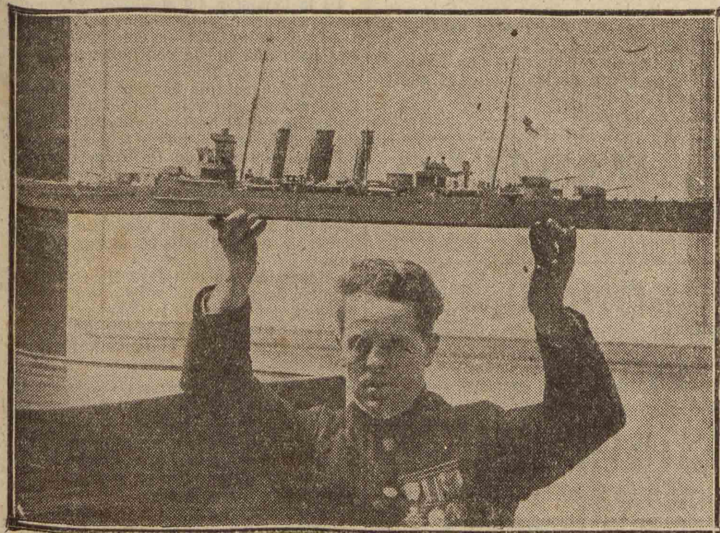
Modelo de uno de los cruceros de diez mil toneladas, a cuya construcción ha renunciado Inglaterra.