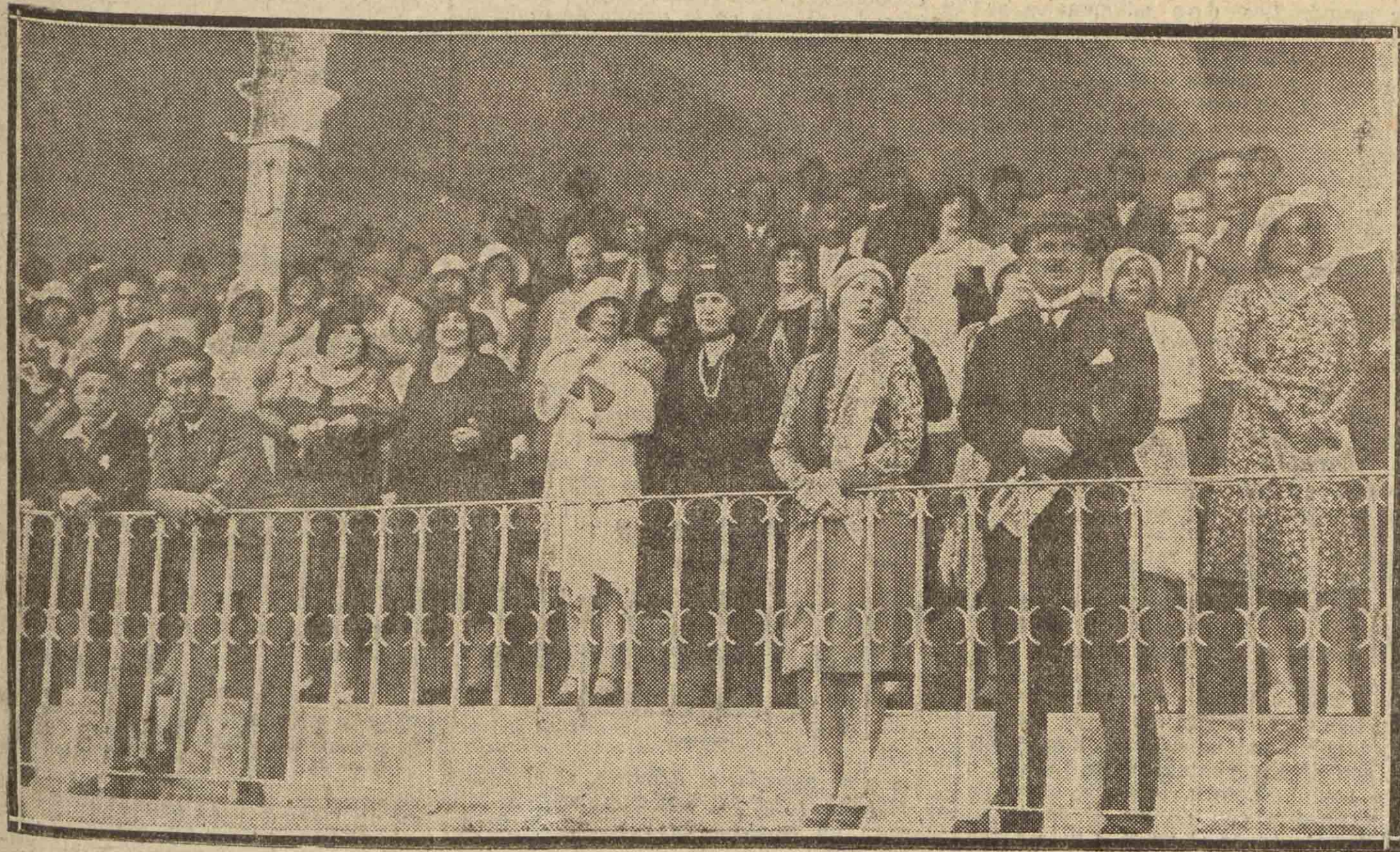
Aspecto de las tribunas del hipódromo durante la reunión de ayer.

El Premio Patronato de Turismo lo ganó "La Magdalena", del conde de la Cimera