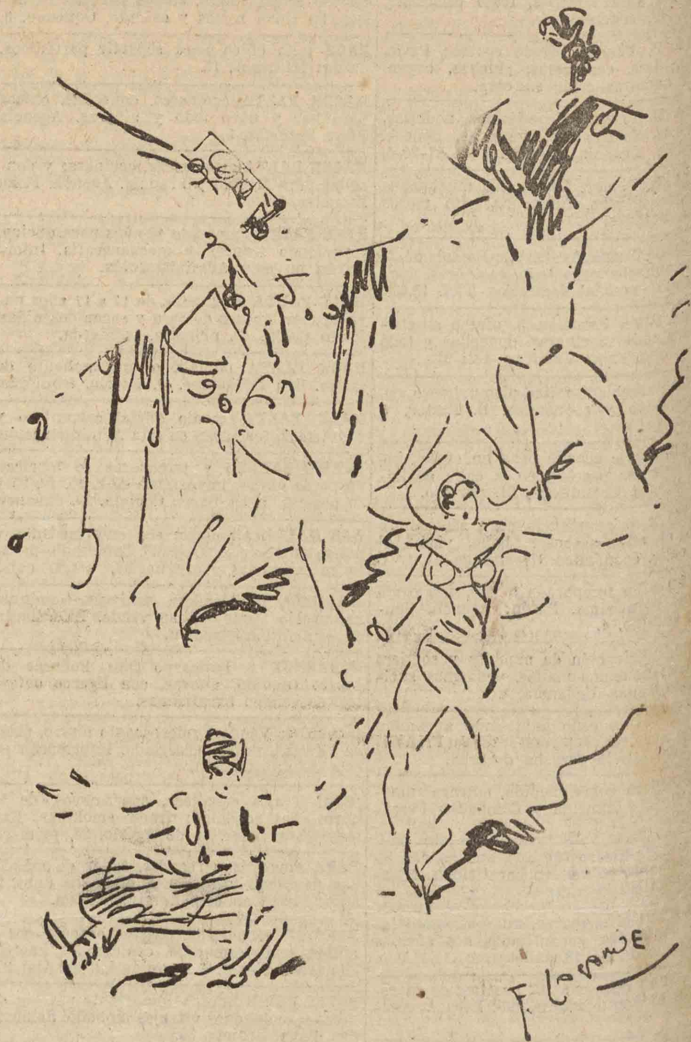
CUATRO RAYAS SOBRE «LAS MARAVILLOSAS», por Lagarde.