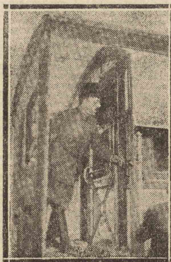
El ex rey de Afghanistan, Amanullah

Los periódicos nos cuentan ya detalles de su último adiós a la tierra dura y primitiva que soñó convertir en Estado a la moderna, democrático y laico. Su partida fué exornada con es-