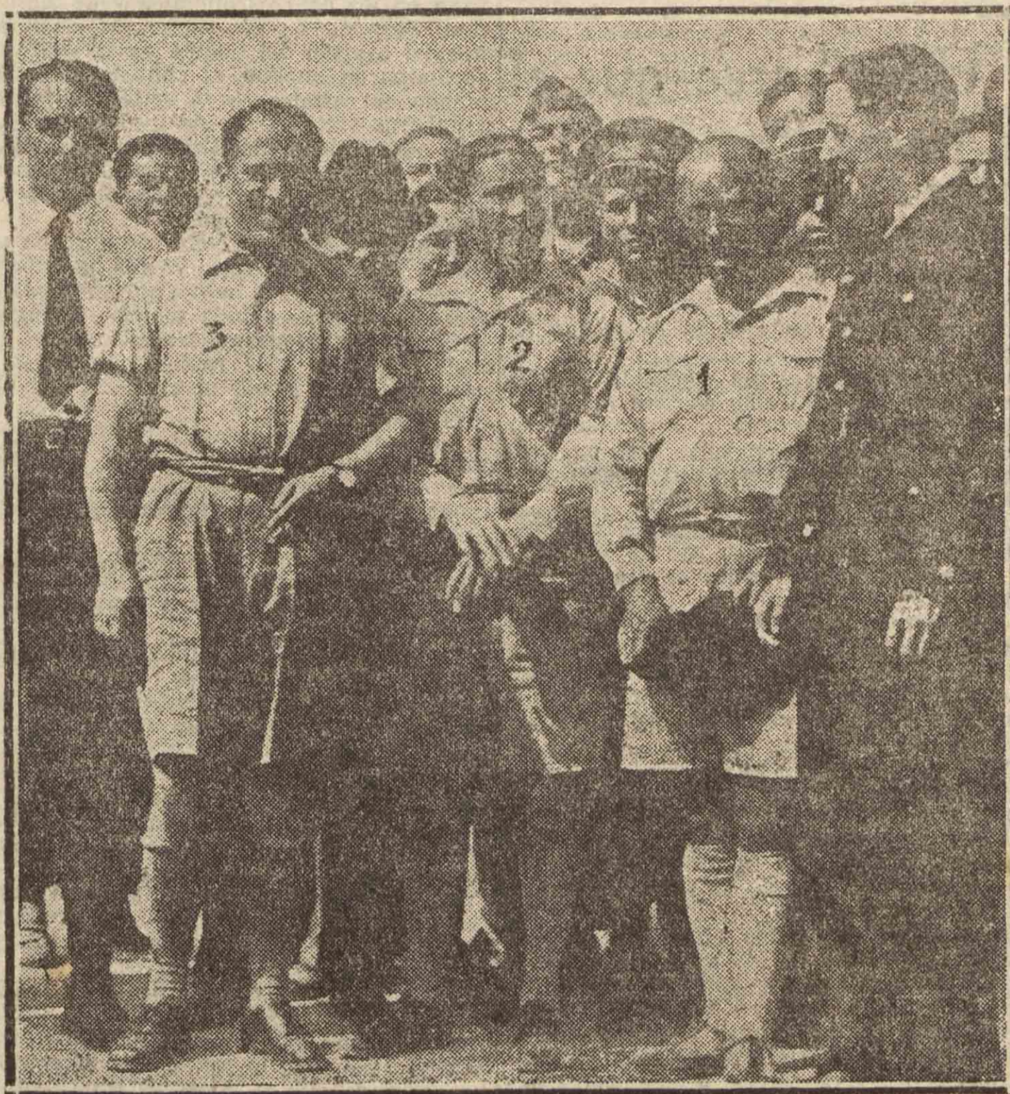
Franco (1), Gallarza (2) y Ruiz de Alda (3), en el aeródromo de los Alcázares, momentos antes de embarcar en el "Dornier número 16" para intentar el viaje trasatlántico, terminado en condiciones que se desconocen, frente a las Azores.

A primera hora de la tarde volvieron los periodistas a visitar al ministro de Marina en