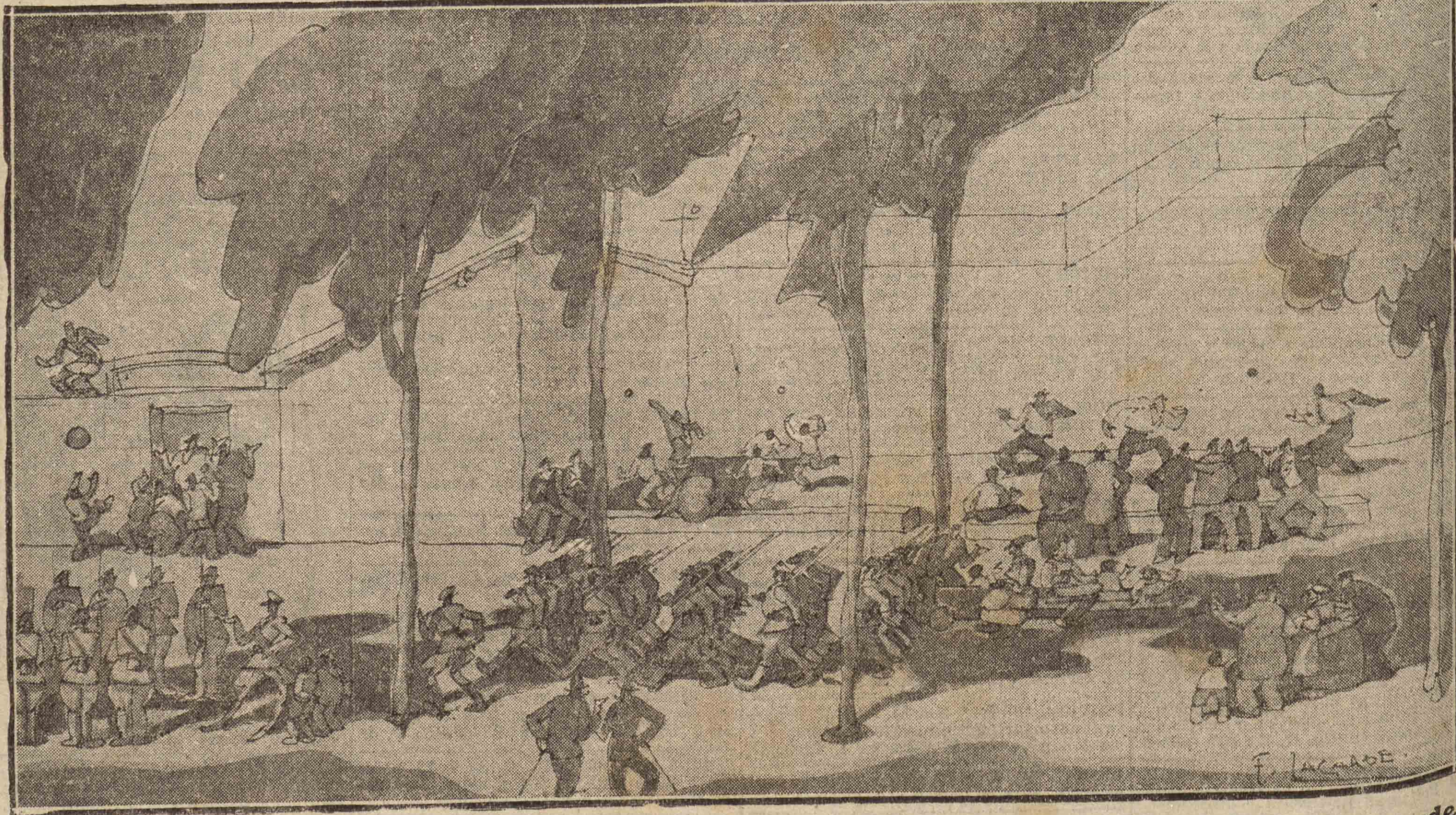
EL FRONTON DE ATOCHA