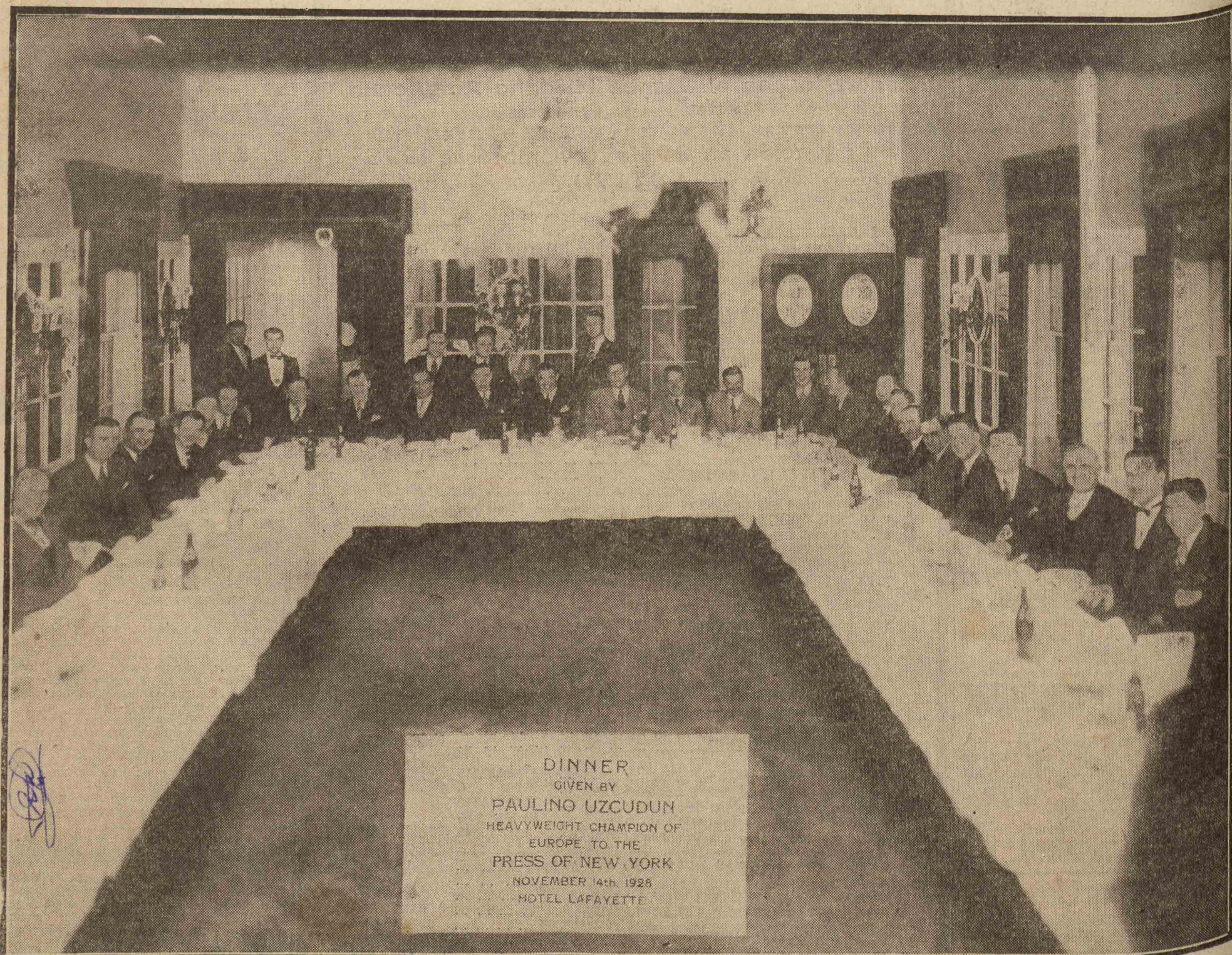
DINNER GIVEN BY PAULINO UZCUDUN HEAVYWEIGHT CHAMPION OF EUROPE TO THE PRESS OF NEW YORK NOVEMBER 14th 1928 HOTEL LAFAYETTE

En el noveno round Paulino coloca de salida un fuerte golpe de izquierda a la cabeza de Hartwell y sigue llevando la ofensiva con