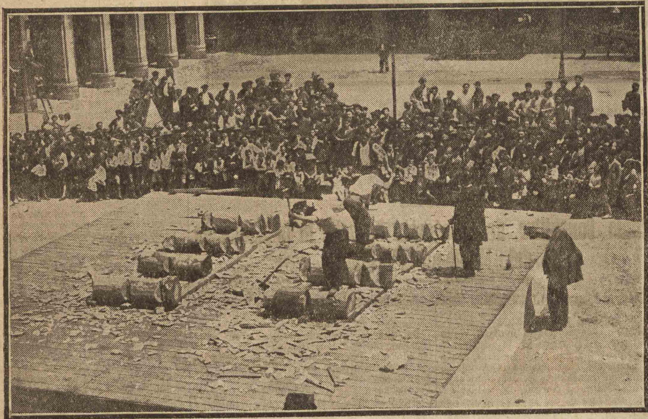
Un aspecto de la Plaza de la Constitución durante el concurso de «aizkolaris» comenzado ayer.

"Aguñeta" vence netamente a "el Navarro" por una diferencia de cerca de 5 minutos