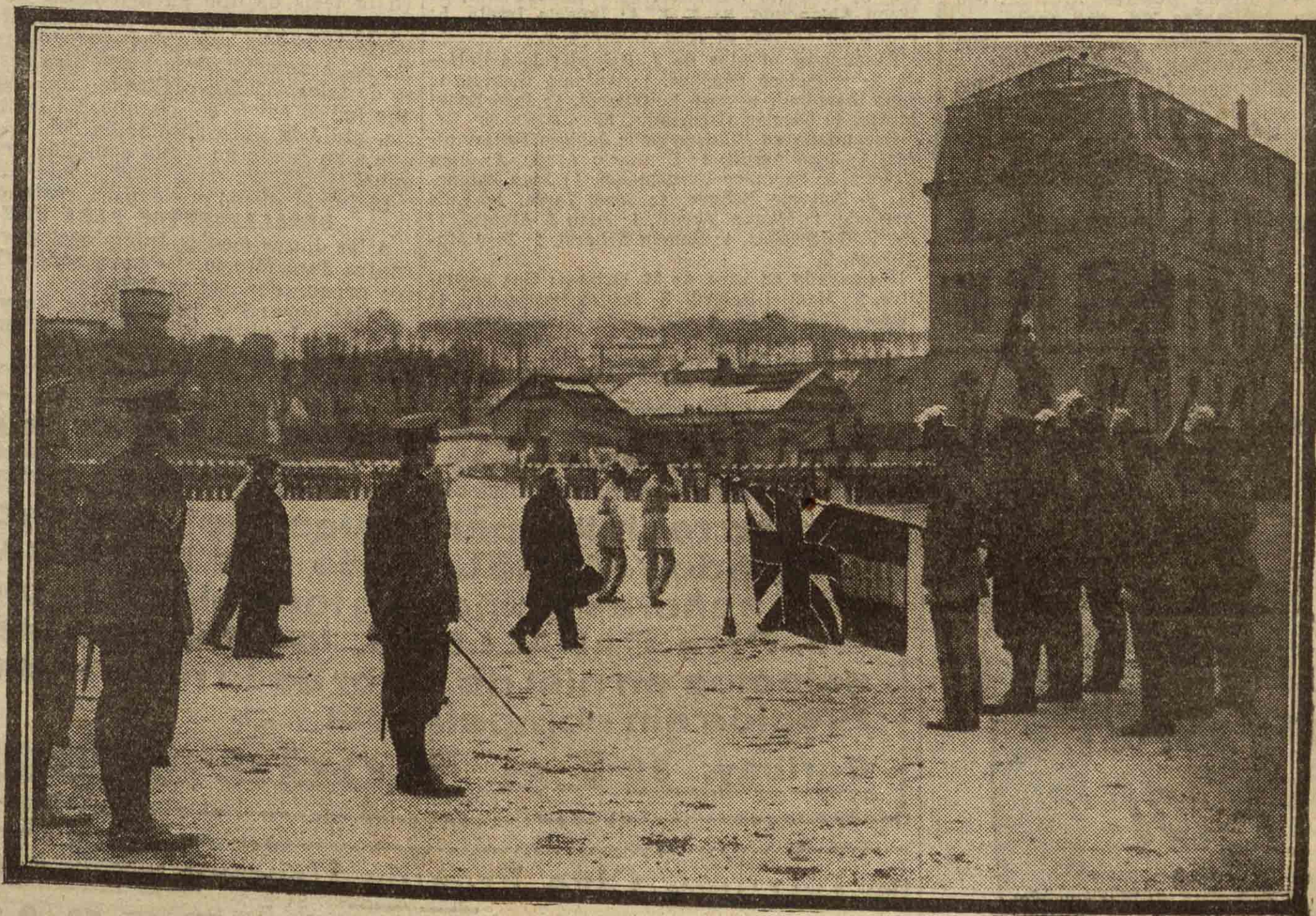
El presidente de la República francesa en la revista de los cadetes ingleses de Sanhurst, que son los huéspedes de la Escuela de Artillería de St. Cyr, en Francia

Este número ha sido visado por la censura