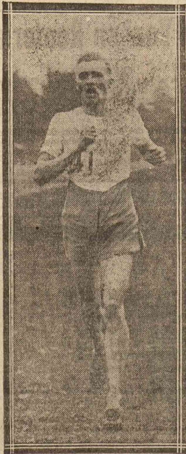
El vencedor Pele llegando a la meta en Vincennes, en el campeonato de cross-country en Francia.

Churrua, 2, 1.º - Tel. 20-78. Consulta de 10 a 1 y de 3 a 6