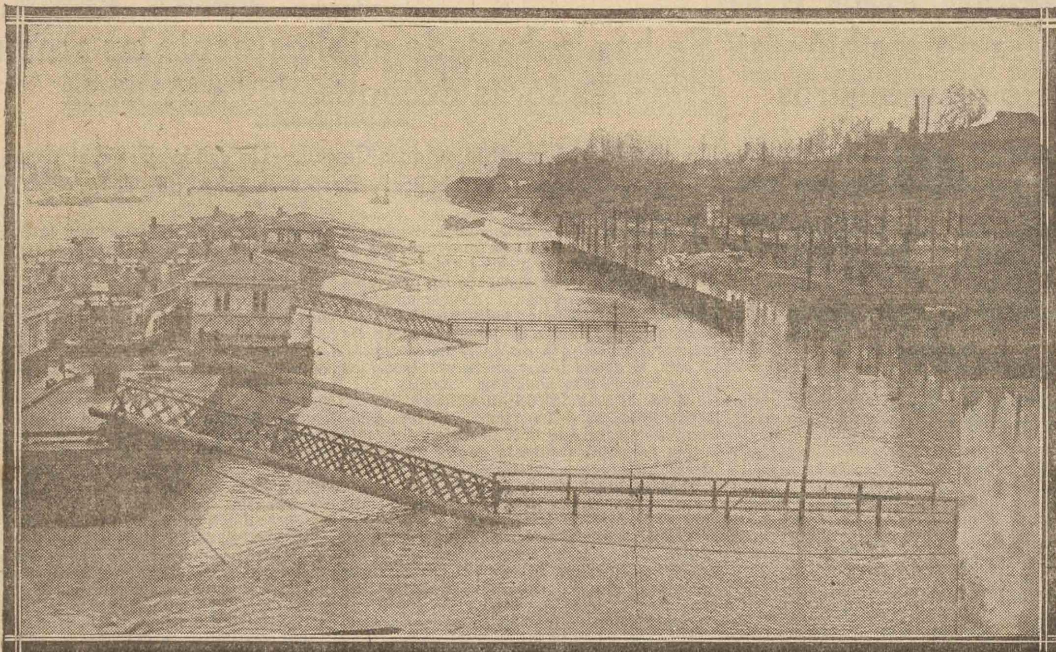
LA CRECIDA DEL SENA. — Los pontones de los vapores que hacen la travesía de París, aislados por el agua que sube de nivel