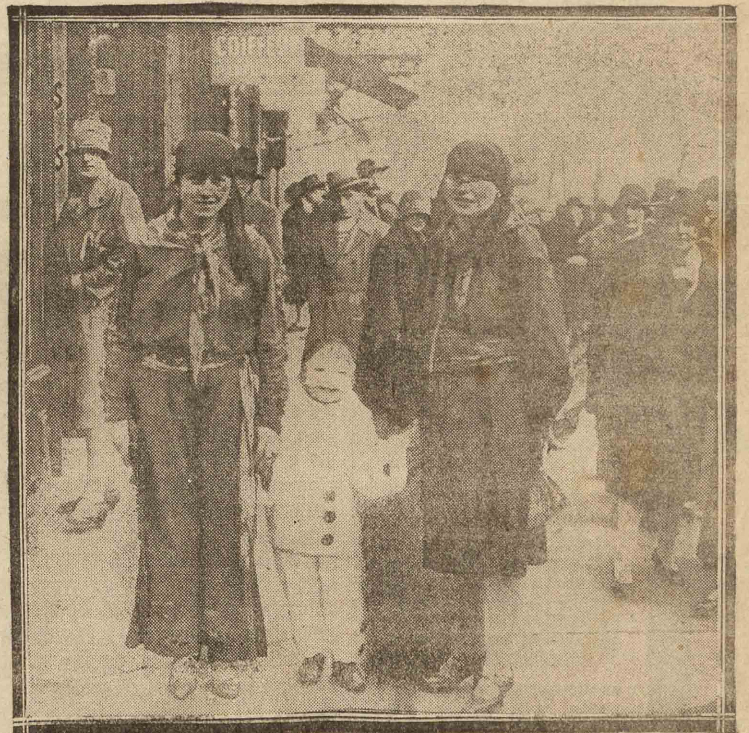
El Carnaval ha estado en París muy desanimado, como en casi todas partes. La capital francesa no hace el menor esfuerzo por contener la decadencia, ya generalizada, de la fiesta. He aquí a un niño, vestido de Pierrot, acompañado de sus parientes, y que fué uno de los pocos que se vieron disfrazados este año en París.

MADRID 25.—Dicen de Casablanca que han sido detenidos en aquella población tres jefes de las organizaciones comunistas de Marruecos. La Policía se incautó a la vez de los libros de contabilidad de aquellas organizaciones y de numerosos folletos preparados para hacer intensa propaganda comunista.