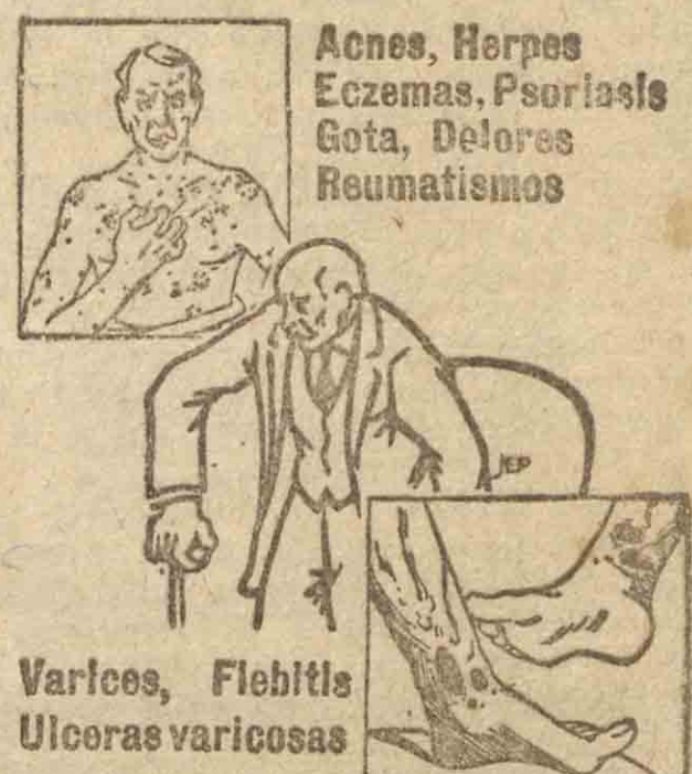
Varices, Flebitis Ulceras varicosas

En vista de ello y de que no hace muchos días, en dos ocasiones, ocurrió una cosa semejante con un colchón y con seis sillas, fué encerrado en los calabozos del Gobierno, a disposición de la autoridad correspondiente.