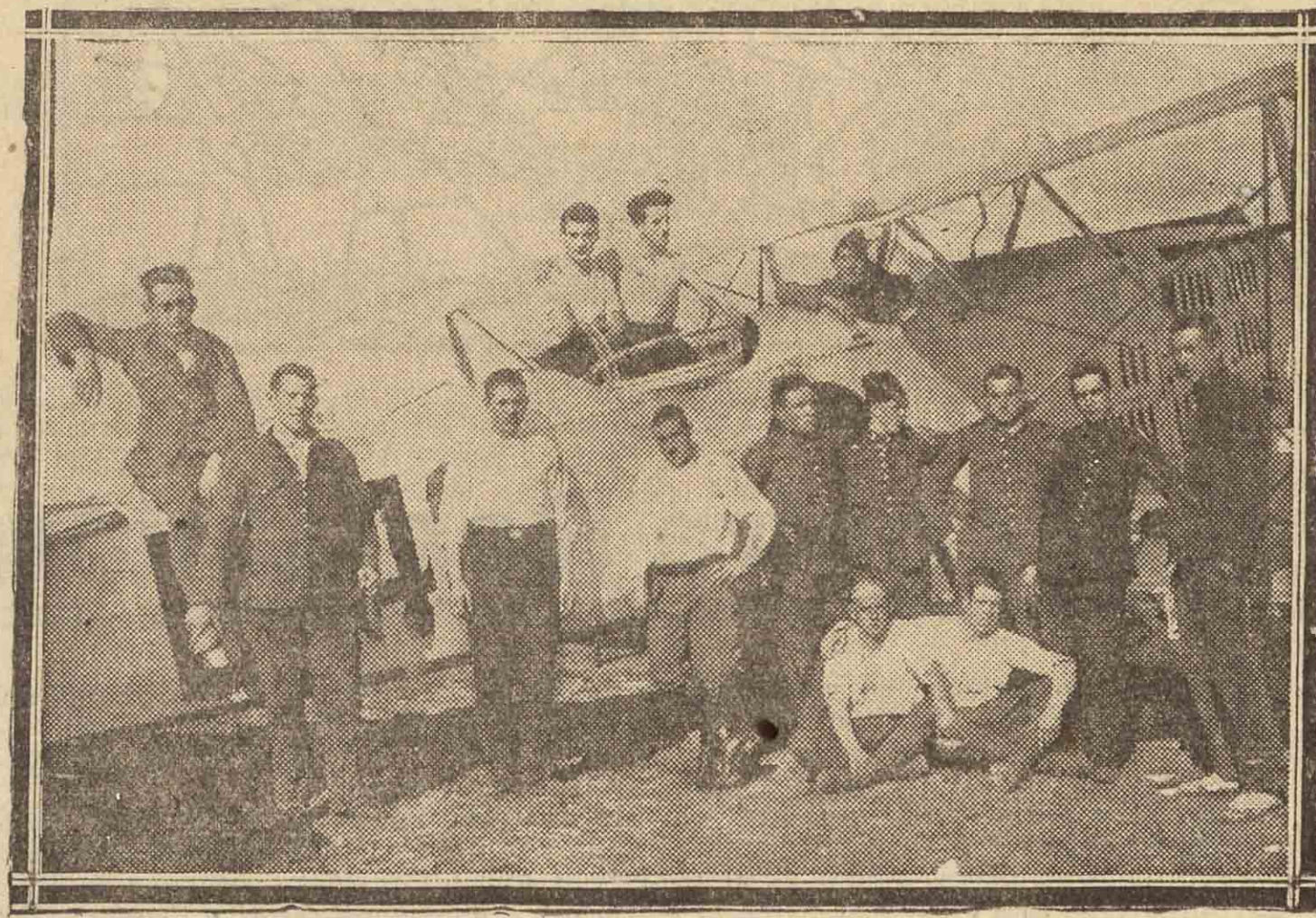
EN SEVILLA. — Grupo de soldados guipuzcoanos que se hallan cumpliendo sus deberes militares en la Sección de Aviación, de Sevilla.