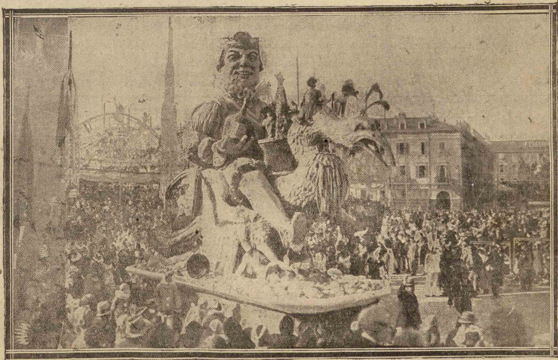
Las fiestas del aniversario del Carnaval al quincuagésimo en Niza, celebradas con gran algazara y en las que se hace un verdadero derroche de color y de ingenio.

SYDNEY, 16. — La Compañía de T. S. H. de Melbourne «3 L-O» dará el próximo domingo un concierto a Europa, con arreglo a la hora francesa y con ondas de 32 metros. (Argos).