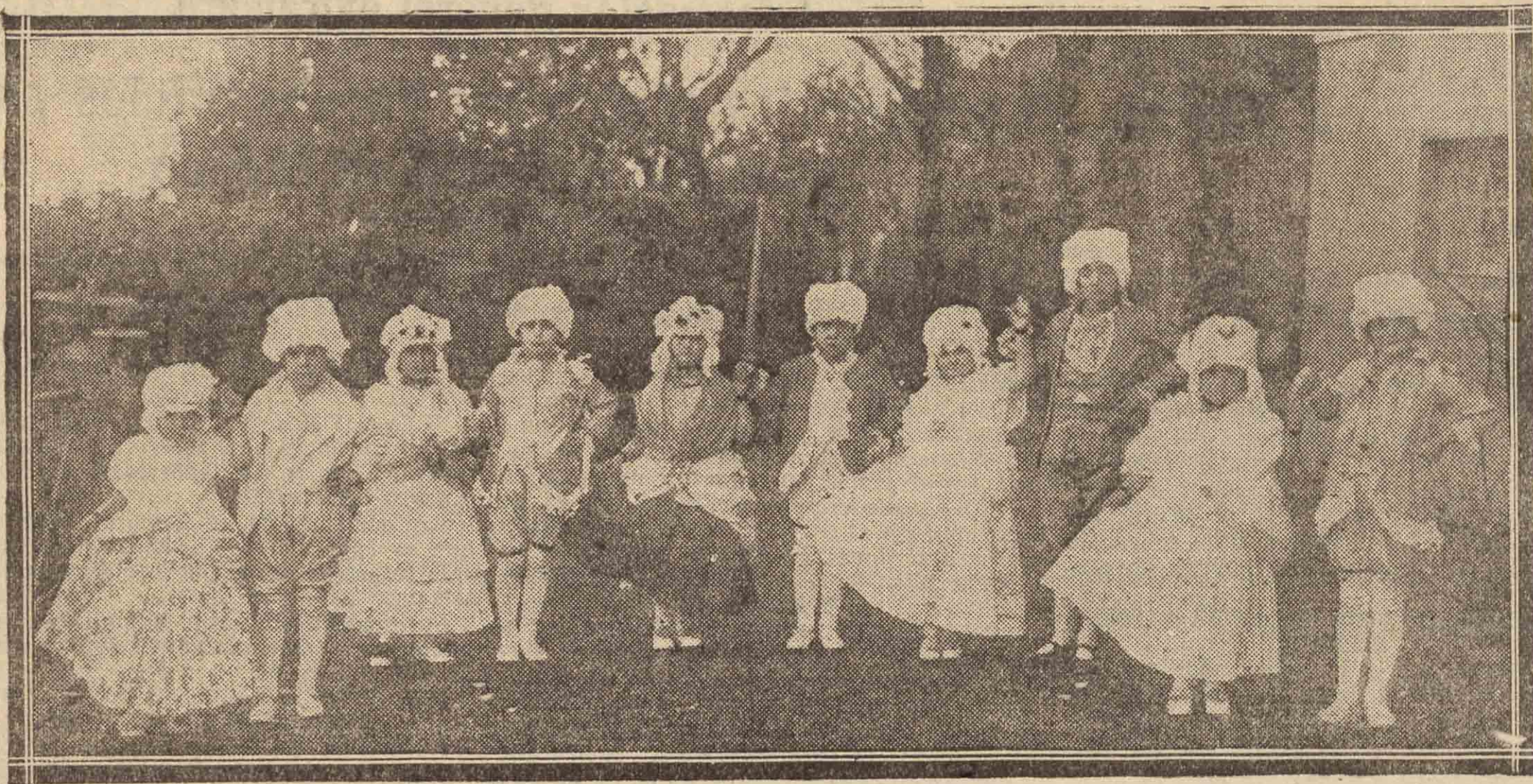
Niñas de la aristocracia que han tomado parte en la función celebrada ayer en el Colegio de «Villa Belén», con motivo de las bodas de plata de su fundación.