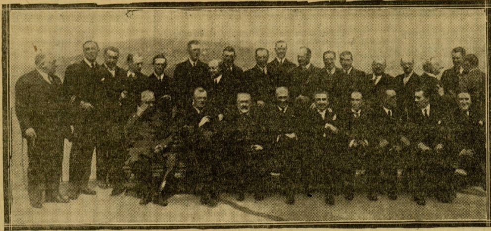
Los marinos suecos y las autoridades donostiaras, después del banquete celebrado ayer tarde en Igueldo.