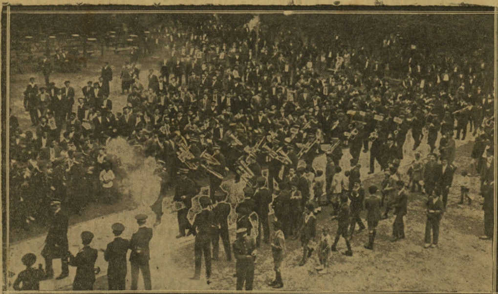
La Banda municipal de Zarauz, a su llegada a Eibar.

En el paseo de los Tilos se corrió por la noche un toro de fuego, y más tarde ejecutó la Banda municipal un bonito programa de bailes. La concurrencia en el paseo, cuyos árboles tenían bombillas de colores, fué enorme, y los bailes fueron bien aprovechados por el ele-