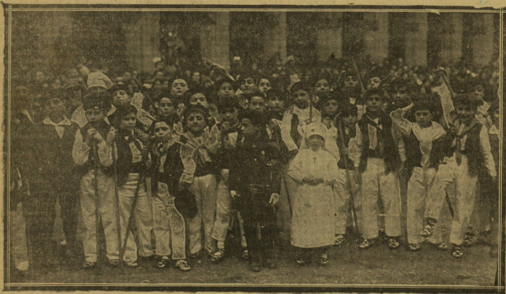
"Artzayas" y "ifudes" de los que tomaron parte en la fiesta celebrada en la Plaza de la Constitución.

La principal atracción de ayer fué la graciosa comparsa de "ifudes" y "artzayas", de Euskal-Bilera. -El baile del Círculo Mercantil se ha celebrado con su brillantez tradicional