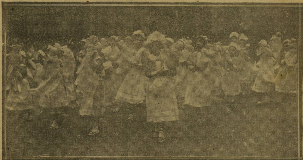
La bella comparsa de diñeses, bailando su típica danza.