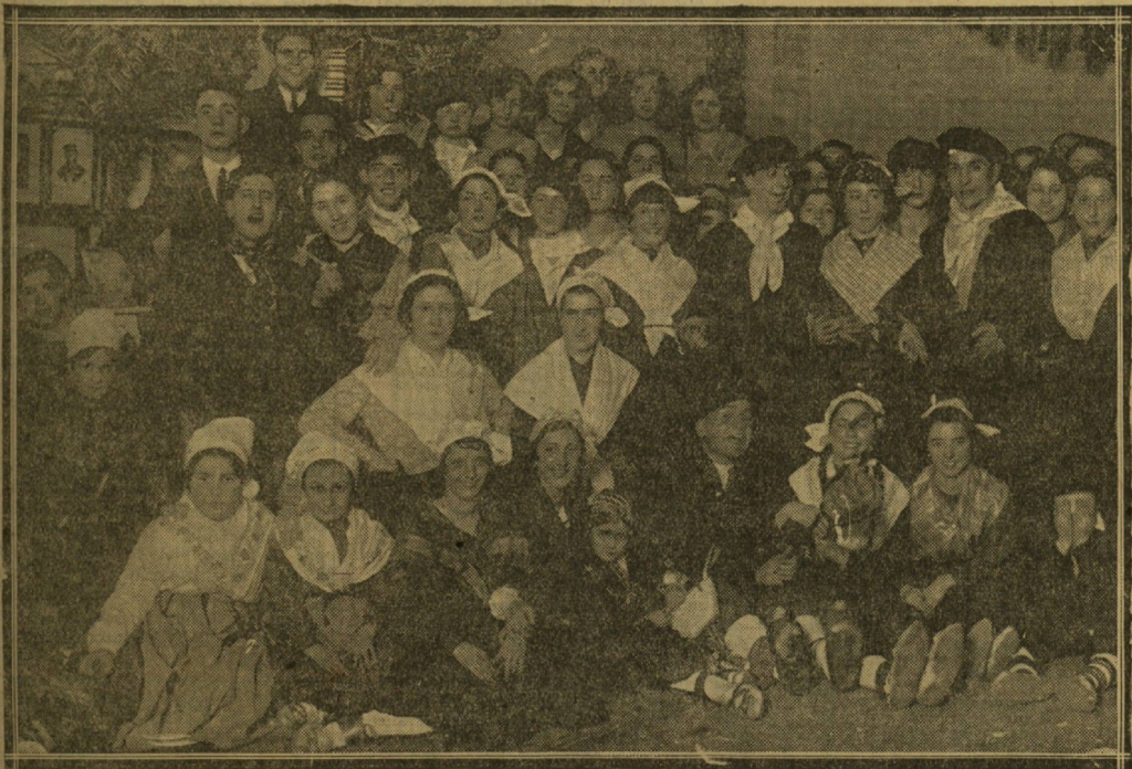
Un grupo de gente joven de la «Unión Artesana», disfrazada de «casheros».

Calle GUETARIA, 14.-Teléfono 8-77 Especialista corazón y pulmones Consulta de 11 a 12 y de 3 1/2 a 5