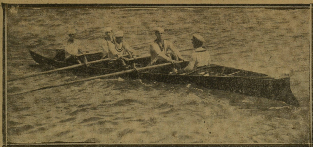
Yola del R. C. N. de San Sebastián, vencedora en la regata celebrada el domingo en nuestra bahía.

Enalteció la labor de los bravos hijos del mar, recordando las palabras que pronunció a raíz de la llegada de los campeones de España en Alicante, ensalzando la grandiosa obra del Supremo Hacedor al contemplar la inmensa llanura donde los llamados hijos del mar luchan con denuedo para ganar el sustento de sus familias. Dedicó párrafos de admiración a los emblemas patrióticos representados en la bandera de Honor.