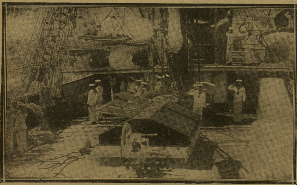
La tripulaci6n de la fragata "Sarmiento", saludando a la plaza, en el momento de entrar en la bah6a. (Foto Guer6quiz).