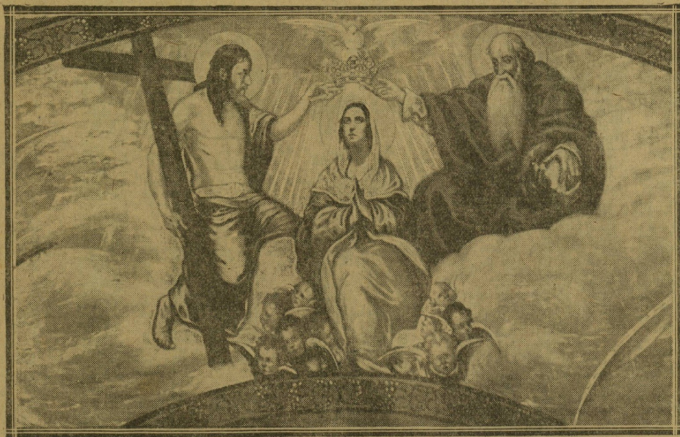
Grupo principal de «La Coronación»

Visitamos una tarde en su estudio al pintor Ascensio Martiarena, porque sabíamos que el notable artista, que tantas veces ha sentido el halago del público parisino, y a quien la crítica extranjera y española ha tratado con verdadero encomio, se hallaba allí, en los altos del Teatro Victoria Eugenia, encerrado frente a una obra de arte decorativo que ha de figurar en la próxima Exposición de París.