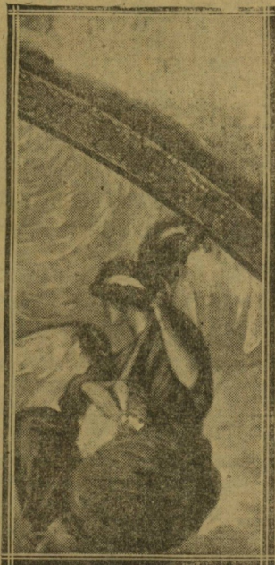
Un detalle de la obra

la cabeza de la Virgen, que es una maravilla, pues a base de una cara humana y que pudiéramos decir de mujer española, ha sabido idealizarla Martiarena de modo