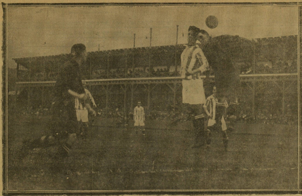
Un aspecto del partido jugado el domingo en el campo de Atocha entre donostiarra y epamplonicas.

... alas, sobre todo cuando éstas se hallan perfectamente desmarcadas. Y eso no hicieron los delanteros donostiarra en los momentos en que ellos llevaban la iniciativa del encuentro, más que en contadísimas ocasiones, y en cambio abusaron del juego por el interior, hallándose constantemente muy cerrados los tres delanteros que componían la tripleta central. Si no fuera porque nuestra línea de ataque ha ganado muchísimo, bajo todos aspectos y que en la actualidad le bastan ligeros momentos de destello para traer una decisión a su favor, es muy posible que su actuación del domingo hubiera causado más disgusto que satisfacción. Los medios estuvieron toda la tarde desco-locados, y ni sujetaron al balón ni hicieron buenos servicios. Esta es otra de las atenuantes que pueden ser aplicadas a la mediana actuación del ataque. Particularmente falló el centro medio, que, dentro de la apatía general, fué uno de los que más se distinguieron. Hagamos una excepción de la defensa, que fué excelente, y tanto Galdós como Beguiristain se multiplicaron y demostraron gran entusiasmo y voluntad. Elizaguirre tuvo también una buena tarde.