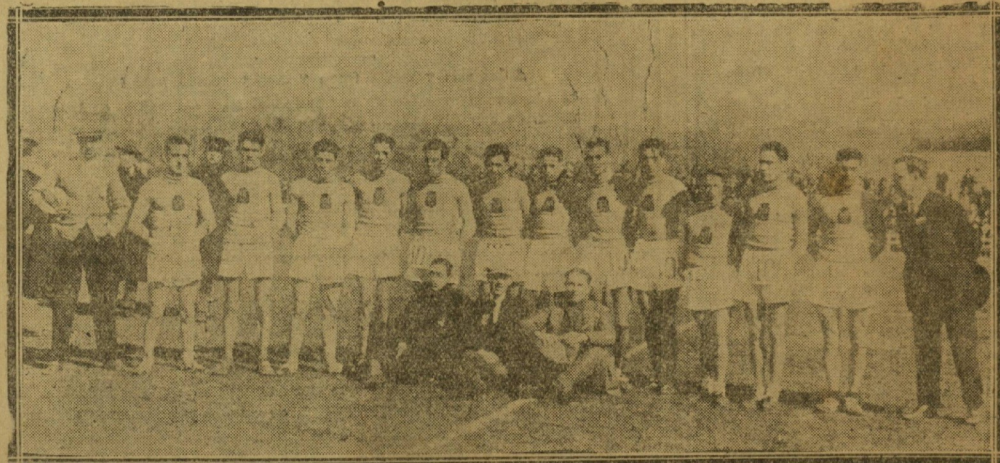
El equipo catalán de cross country, que ha resultado vencedor en la clasificación por regiones, celebrado el domingo.