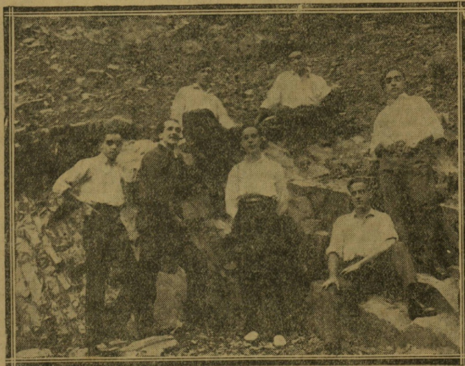
Finalistas del concurso de 15 montañas, pertenecientes a la Sociedad Deportiva "Aitza-Praka" de Eibar, que han resultado vencedores en dicha prueba alpina.

Especialista corazón y pulmones Consulta de 11 a 12 y de 3 y media a 5. Calle GUETARÍA, 14. — Teléfono, 8.77