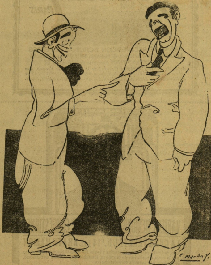
—Te digo que van a ganar neriak.