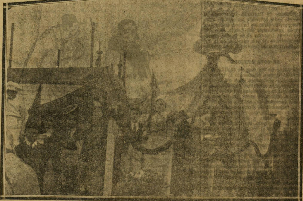
La carroza de "Euskal-Billera", presidida por una bellísima señorita, erigida en esta del Carnaval..

Llegada la hora, penetraron en el comedor, en animados grupos, encantadoras muchachas lujosamente ataviadas, que iban en compañía de sus familias y conocidos, tomando asiento en las coho largas mesas dispuestas para la cena. La presidencia la ocuparon el alcalde señor Azcona, el presidente del Círculo señor Pérez Egea y varios individuos de la Directiva. La fría etiqueta de los primeros momentos, fué prontamente eclipsada por la franca y jovial alegría, que lleva siempre como singular característica la juventud y más cuando entre varón y varón se intercalan señoritas de hermosura incomparable, dispuestas a bailar y divertirse.