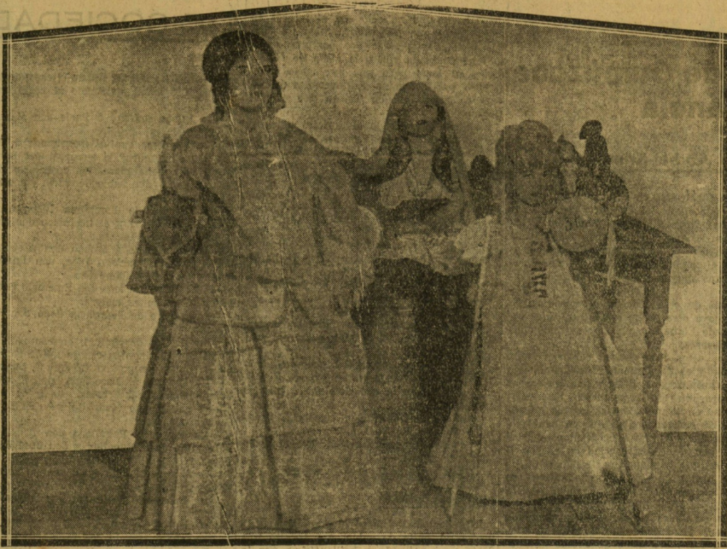
LOS TRES NIÑOS QUE OBTUVIERON LOS PREMIOS DEL CONCURSO DE DISFRACES DEL GRAN KURSAAL.

y deseosas de la hora en que el "jazz-band" dejara oír sus estridentes acordes.