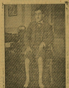
El mismo á los cuatro meses de tratamiento.

En Bilbao: Gabinete Médico-Mecánico, Gimnasia, Ortopédica, Rayos X, Cirujía Ortopédica Viuda de Epalza (antes Estufa) núm. 6