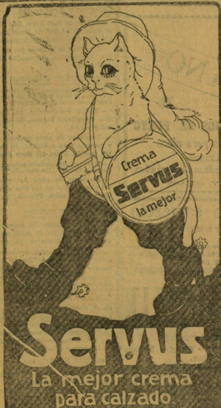
Fabricantes: Lubszynski y C.ª, Berlín, Lichtenberg.