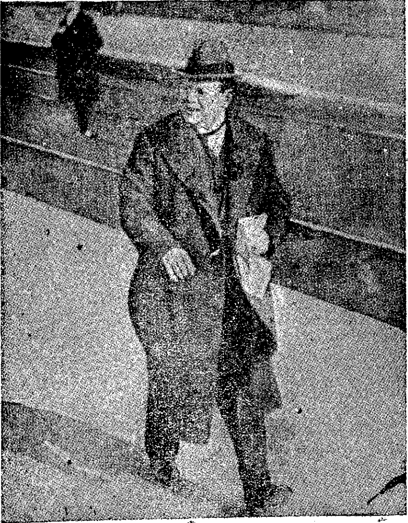
El diputado alemán Erzberger, ausado en el Parlamento por haber firmado el armisticio con los franceses.