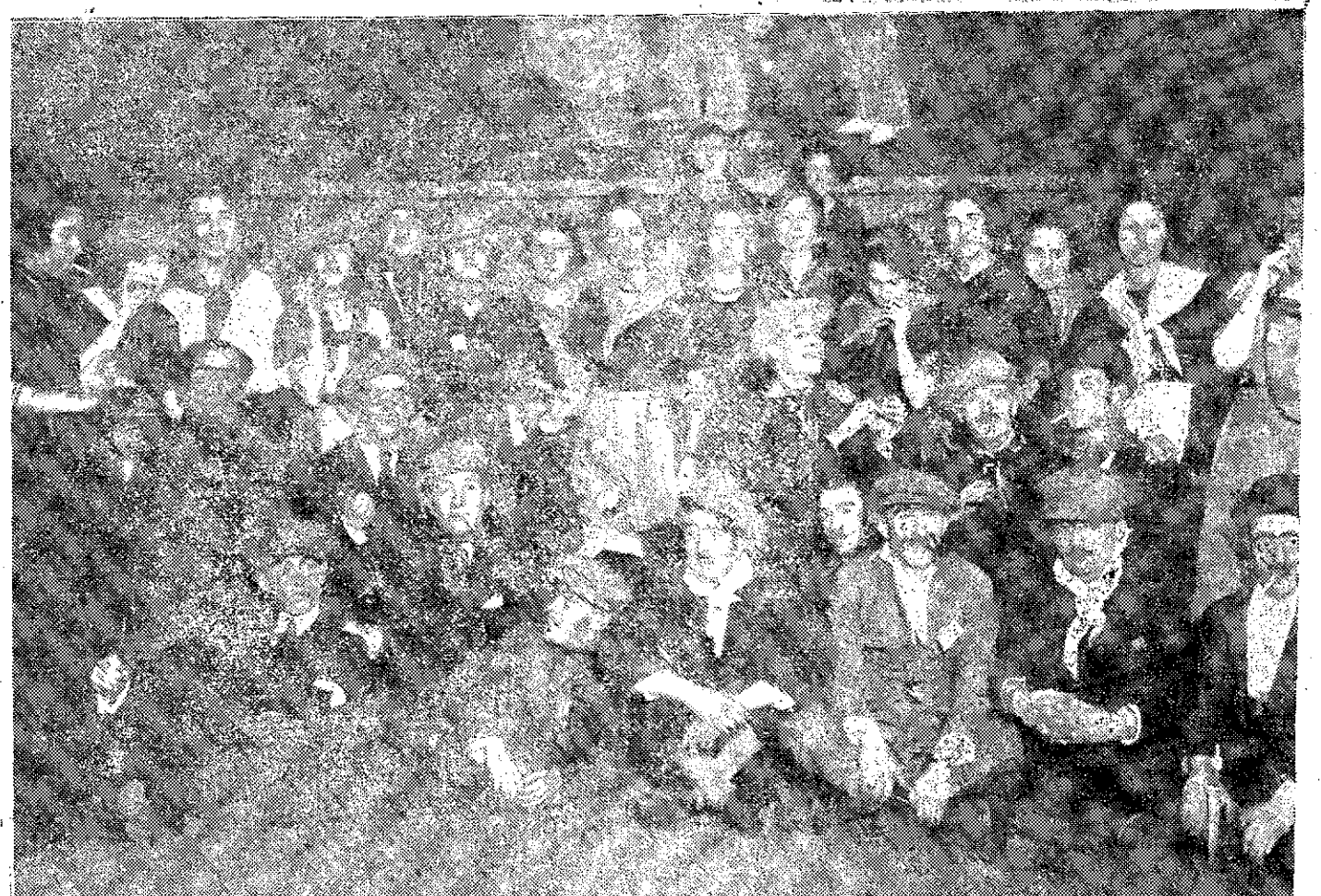
Grupo de concurrentes al Circolo Mercantil, donde se celebró el domingo un baile de apaches

Los partidos políticos de orden, marchan por una falsa vía; no piensan sino en sacar candidatos de partido.