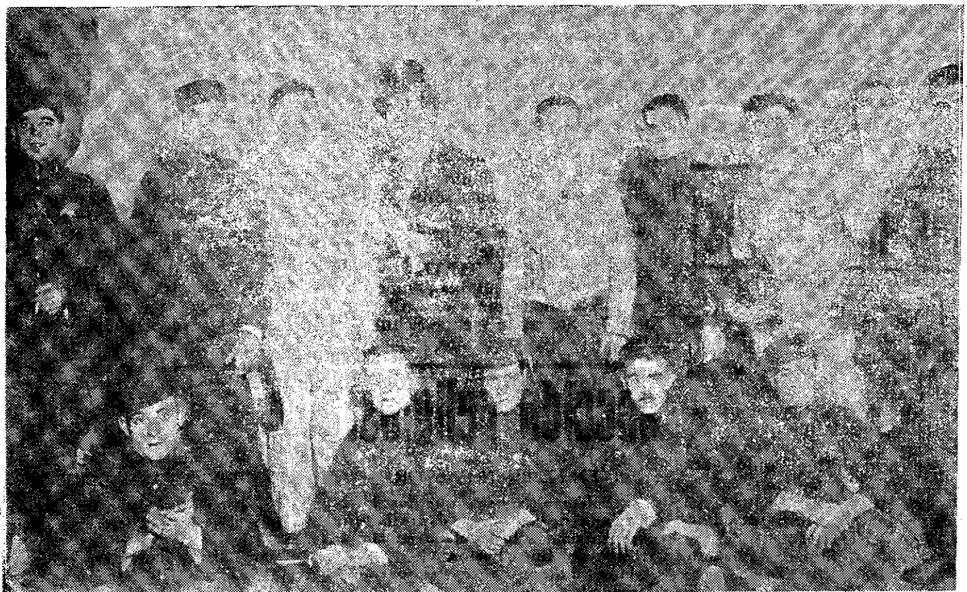
Los soldados del regimiento de Sicilia que tomaron parte en la velada en el teatro Victoria Eugenia.