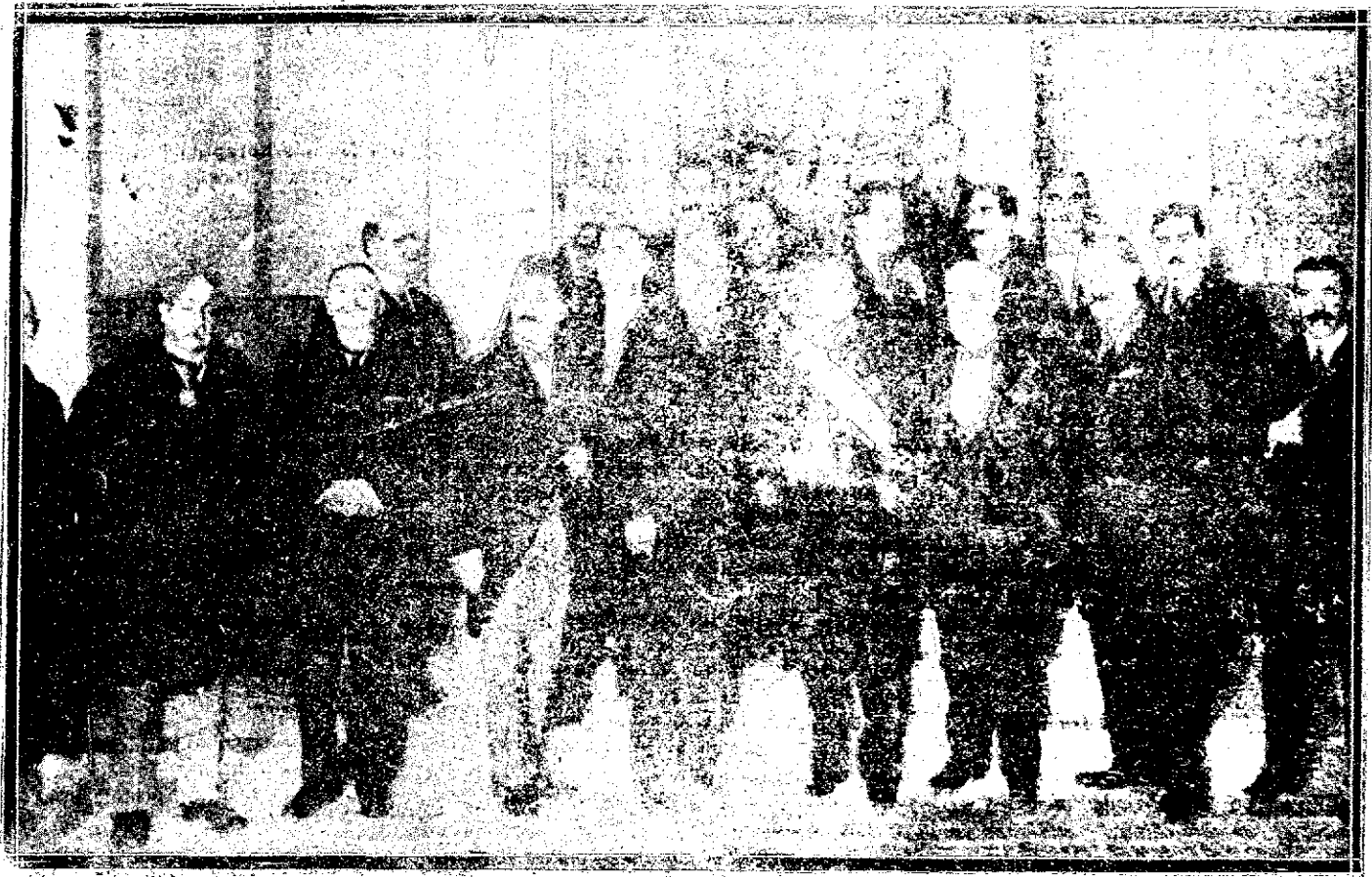
REAL ACADEMIA NACIONAL DE MEDICINA.—Inauguración del año 1920, celebrado últimamente en Madrid, y señores presentes en el año 1919.