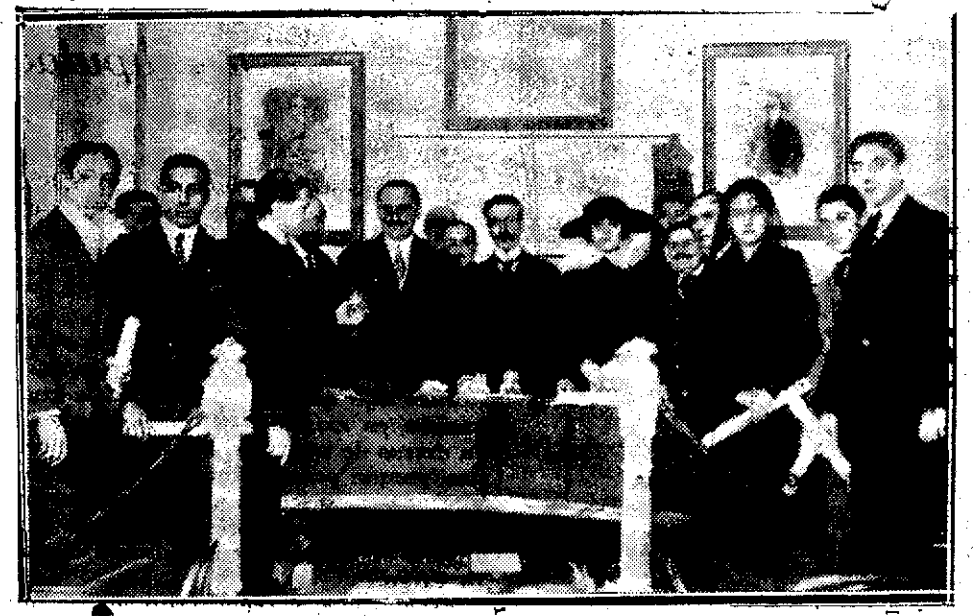
Reparto de premios en el nuevo Circolo Maurista del distrito del Hospitolo.