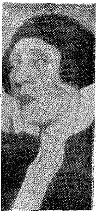
La notable pintora Victoria Malinowska.