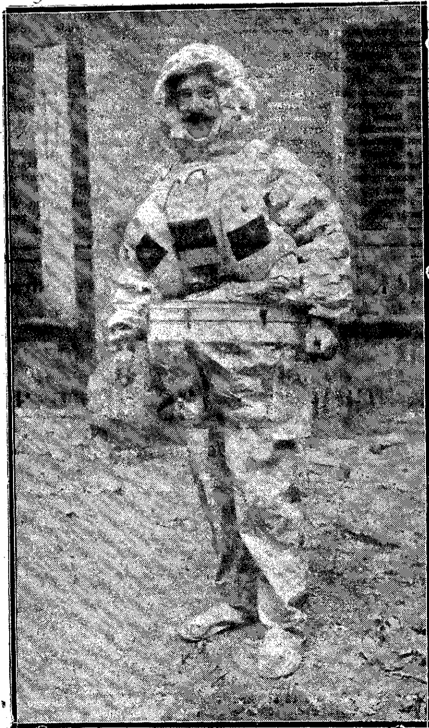
D. Ricardó Ricardó, con su nuevo aparato "Sofía", de que es inventor, y del que nos ocupamos en la página tercera.

Exposition de 10 h. a 8 h. por tres jours seulement.