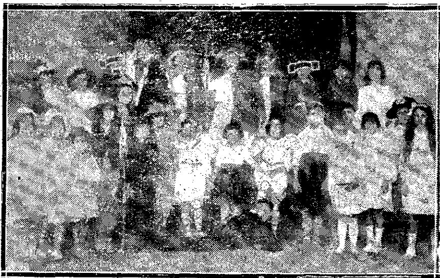
Colonia escolar de la importante villa, que se halla en Arrate, y que representaron "Mirentxu", con gran éxito.