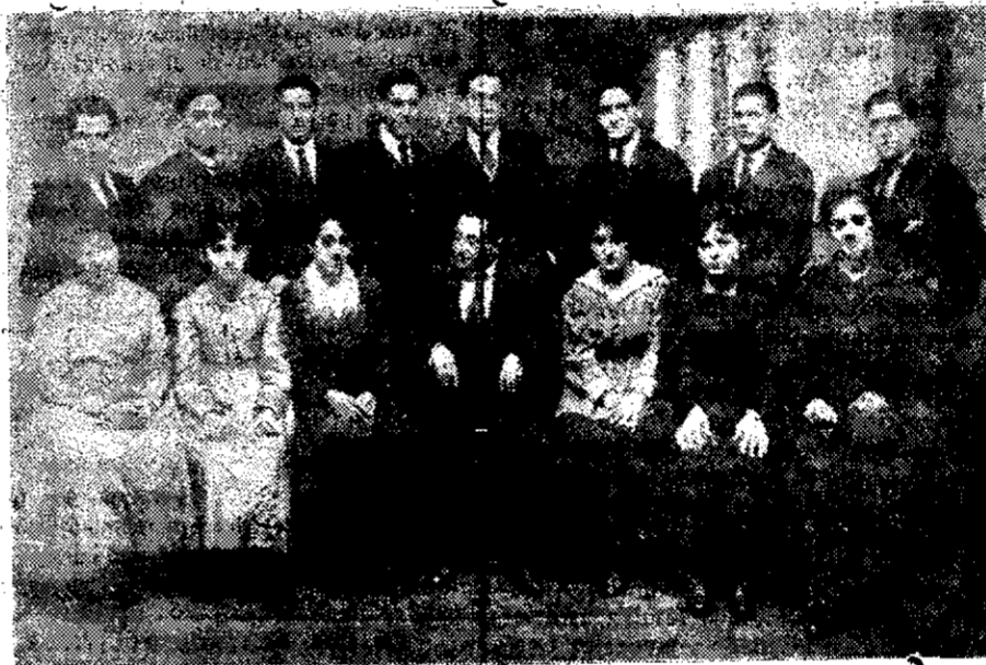
CUADRO DRAMATICO DEL "EIBAR-CLUB", QUE SE DISTINGUE POR SUS TRABAJOS EN FAVOR DE LA BENEFICENCIA