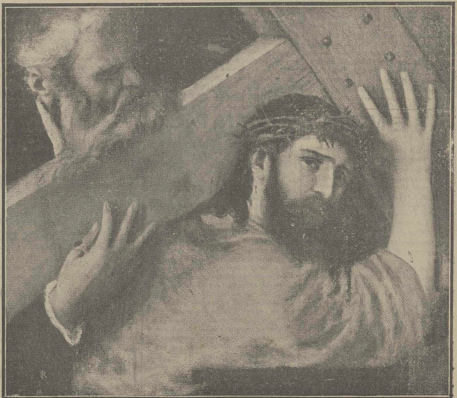
CRISTO AYUDADO POR EL CIRINEO.—Tiziano.—Museo del Prado.

MAÑANA, DIA DE VIERNES SANTO, EN QUE LA CRISTIANDAD LLORA EL DOLOR DE CRISTO CRUCIFICADO, NO SE PUBLICARA "LA CONSTANCIA", SEGUN TRADICIONAL COSTUMBRE :