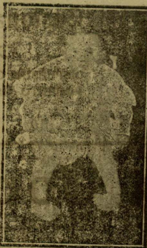
JUAN LETE Isondo (Guipúzcoa) Antes del tratamiento

El Ortopédico don Fermín Salaverri recibe consultas todos los meses los días 1 y 2 en el Hotel Arana, calle Vergara de San Sebastián, de 10 á 1 y de 3 á 5.