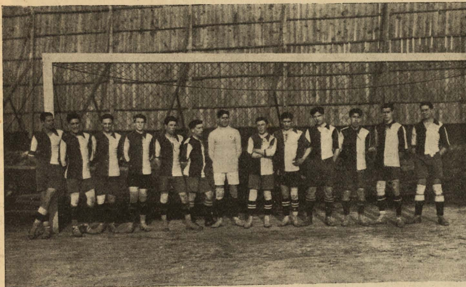
REAL VIGO SPORTING CLUB