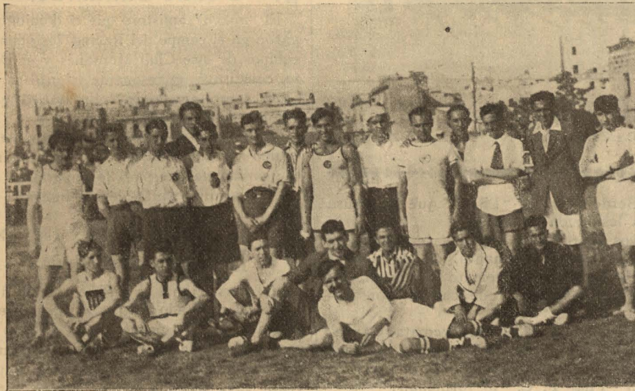
GRUPO DE ATLETAS CATALANES