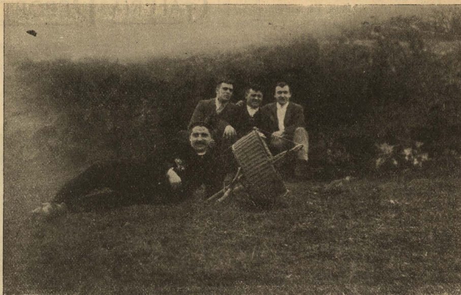
CAZADORES DE EIBAR MOMENTO DE LA SUELTA DE PERDICES