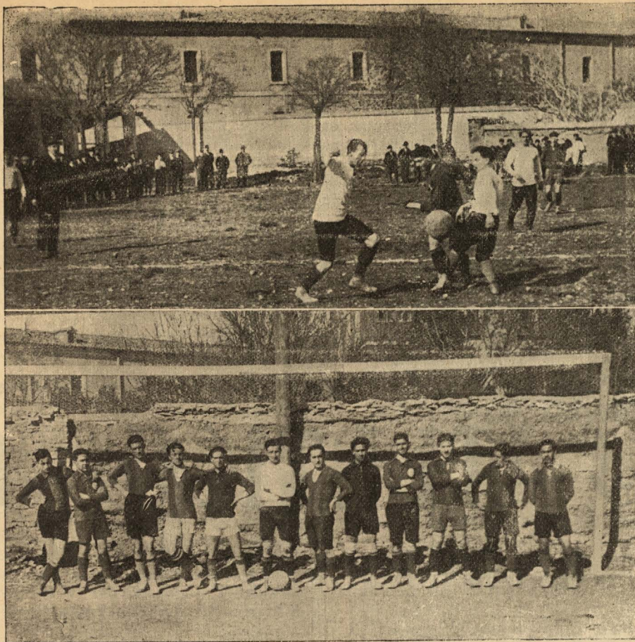
EL PARTIDO, «PILAR F. C.» Y «CAMFRÓN F. C.» EN ZARAGOZA . EQUIPO DEL «PILAR F. C.» ZARAGOZA